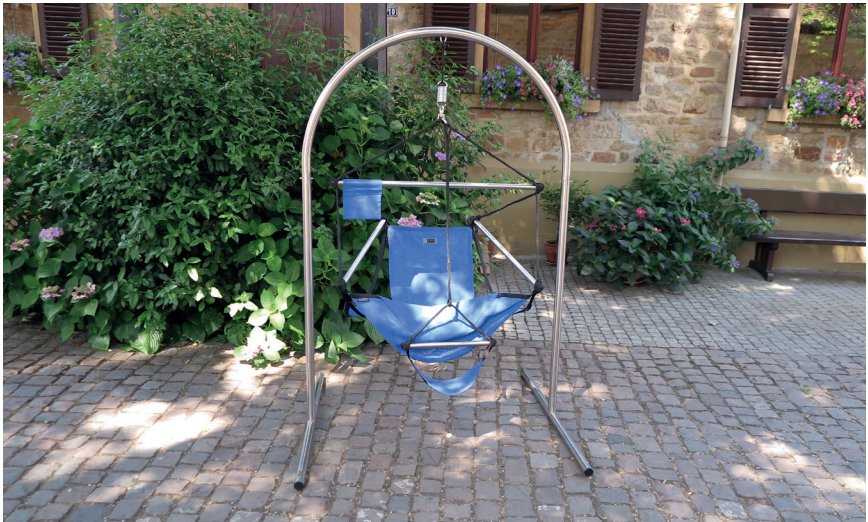
Abgebildet ist der Ständer MONDO mit dem Hängesessel ONE

CrazyChair® ist die international eingetragene Marke der Pimiento OHG, für exklusive, hochwertige Hängesessel, Hängematten, Edelstahlständer und passendes Zubehör.