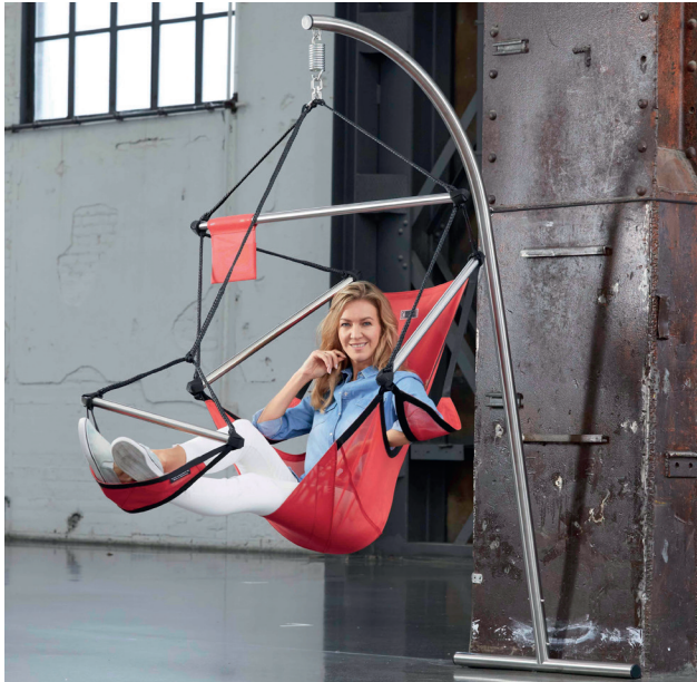
Abgebildet ist der Ständer MEZZO mit dem Hängesessel ONE

CrazyChair® ist die international eingetragene Marke der Pimiento OHG, für exklusive, hochwertige Hängesessel, Hängematten, Edelstahlständer und passendes Zubehör.