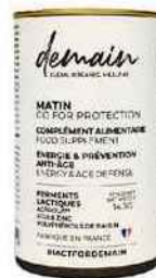
● GO FOR PROTECTION COMPLÉMENT ALIMENTAIRE ANTI-OXYDANT ET ÉNERGISANT, 30 gélules, 30 €