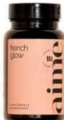
● FRENCH GLOW, 60 gélules, 30 €