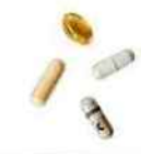
● SYNCHRONISATION NUTRITIONNELLE HOLIYOUTH, 30 sachets, 85 €