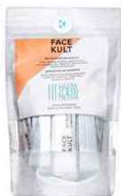
● BOOSTER DÉTOX ET ÉCLAT FIT GLOW, 28 sachets, 39 €