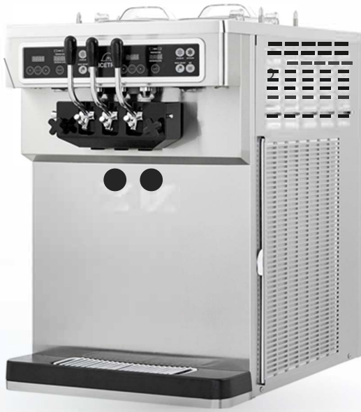
Modelo de tabla superior