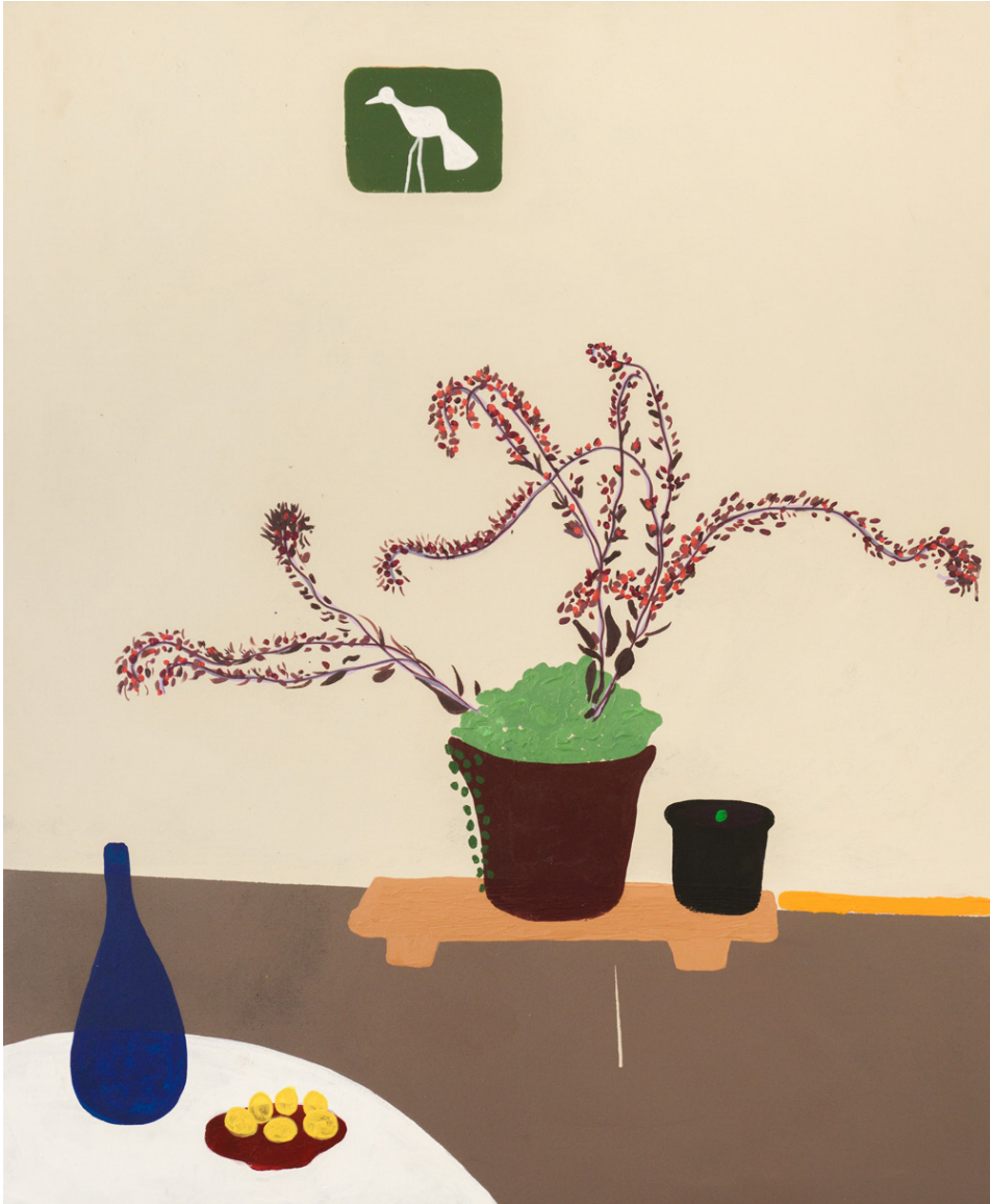
Sunday View Acrílico sobre tela 120 x 100 cms