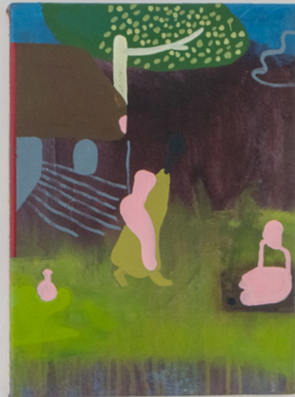
Secondary Village I Acrílico y óleo sobre tela. 2021 46 x 34 cms