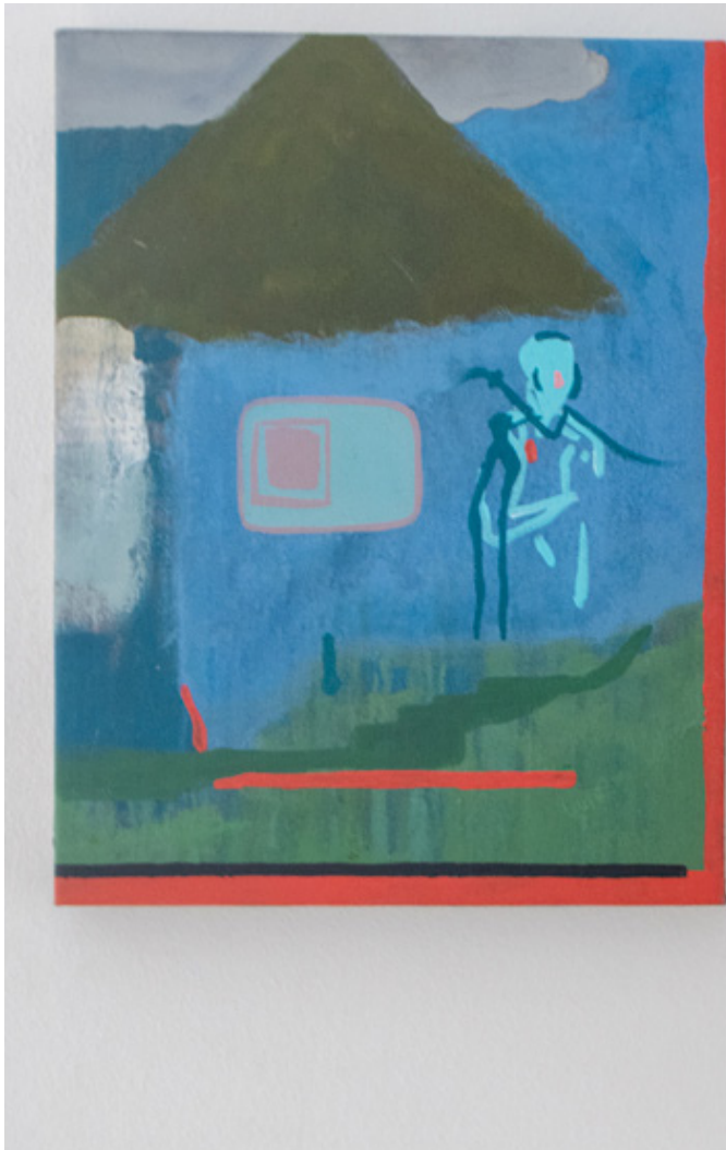
Secondary Village II Acrílico y óleo sobre tela. 2021 46 x 34 cms