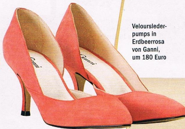
Veloursleder-pumps in Erdbeerrosa von Ganni, um 180 Euro