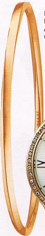
Roségoldbeschichteter Armreif von Christ, um 40 Euro