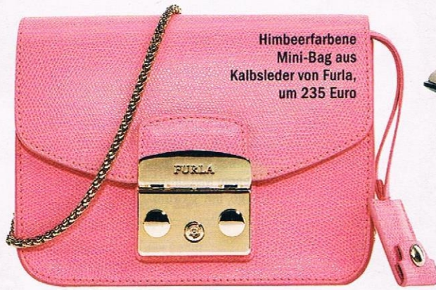
Himbeerfarbene Mini-Bag aus Kalbsleder von Furla, um 235 Euro