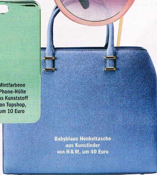
Babyblaue Henkeltasche aus Kunstleder von H & M, um 40 Euro