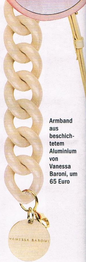
Armband aus beschichtetem Aluminium von Vanessa Baroni, um 65 Euro