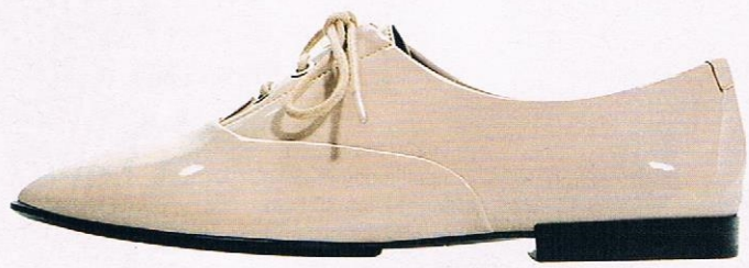
Nudefarbener Lackschnürer aus Kunstleder von Zara, um 30 Euro