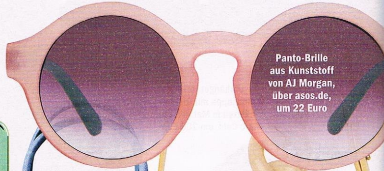
Panto-Brille aus Kunststoff von AJ Morgan, über asos.de, um 22 Euro