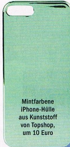
Mintfarbene iPhone-Hülle aus Kunststoff von Topshop, um 10 Euro

Ein Hauch von Retro und Lady-Chic macht diese Begleiter ideal fürs Büro