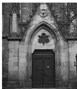
Церковь святого Фомы