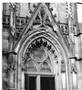
Церковь святого Фомы

Между великим И. С. Бахом и деятелем Реформации существовали невидимые многочисленные связи. В 1498-1501 годы в церковном хоре городской церкви Святого Георгия города Айзенаха пел Мартин Лютер, а 23 марта 1685 года в ней крестили маленького Иоганна Себастьяна. В церкви святого Фомы города Лейпцига 24 июня 1519 года состоялось богослужение по случаю публичного диспута между Мартином Лютером и Иоганном Эком, а в День Святой Троицы в 1539 году праздничную службу провел сам реформатор. С 1723 по 1750 годы Иоганн Себастьян занимал должность кантора в этой же церкви. Композитор использовал в своих произведениях мелодии, составляющие основу лютеранского богослужбного обихода. Наиболее часто встречающийся хорал «Aus tiefer Not schrei' ich zu dir» («Из бездны бед воззвак к Тебе») принадлежит перу Лютера.