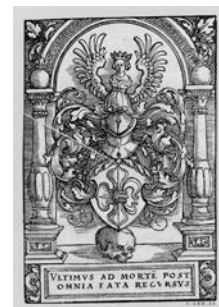
Герб Лазаруса Шенглера

Между великим И. С. Бахом и деятелем Реформации существовали невидимые многочисленные связи. В 1498-1501 годы в церковном хоре городской церкви Святого Георгия города Айзенаха пел Мартин Лютер, а 23 марта 1685 года в ней крестили маленького Иоганна Себастьяна. В церкви святого Фомы города Лейпцига 24 июня 1519 года состоялось богослужение по случаю публичного диспута между Мартином Лютером и Иоганном Эком, а в День Святой Троицы в 1539 году праздничную службу провел сам реформатор. С 1723 по 1750 годы Иоганн Себастьян занимал должность кантора в этой же церкви. Композитор использовал в своих произведениях мелодии, составляющие основу лютеранского богослужбного обихода. Наиболее часто встречающийся хорал «Aus tiefer Not schrei' ich zu dir» («Из бездны бед воззвак к Тебе») принадлежит перу Лютера.