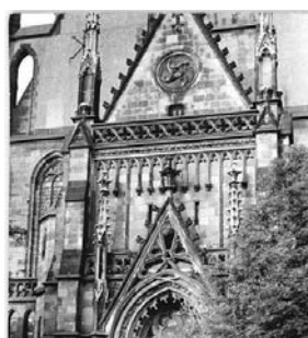
Церковь святого Фомы