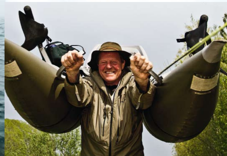
En Anderson-båt väger inte ens 20 kilo och bäras utan problem på axlarna.

Snillrik lösning – det gäller att kunna ha ordning på fluglinan i pontonbåten.