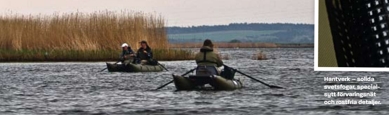
Hantverk – solida svetsfogar, specialsytt förvaringsnät och rostfria detaljer.