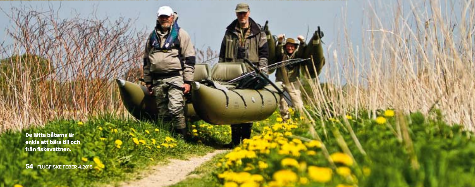
De lätta båtarna är enkla att bära till och från fiskevattnen.

”DET FINNS ETT MOTSTÅND ATT PACKA UPP OCH NER BÅTEN, OCH MAN TROR ATT TRANSPORTEN ÄR JOBBIG MEN FAKTUM ÄR ATT BÅTEN SÄTTTS IHOP PÅ NÅGRA MINUTER...”