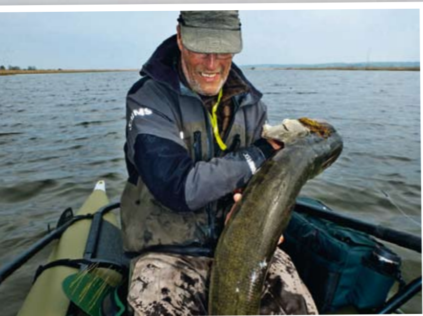
Stora fiskar är inget problem trots en liten båt.