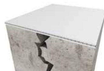
4. KÖSTER Flex weefsel wordt in de 1e laag ingebed