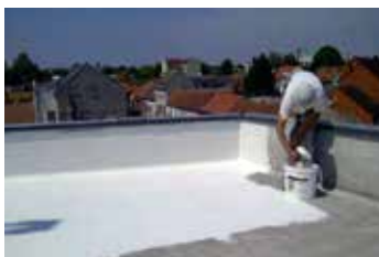
3. 1e laag KÖSTER 21