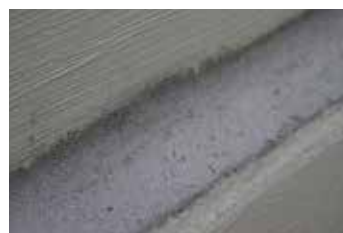
2. Holle plint met KÖSTER Reparatiemortel