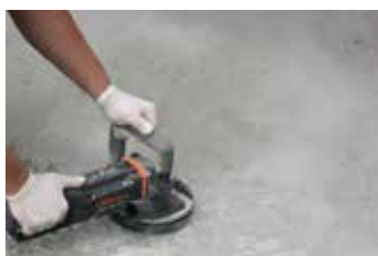
1. Ondergrond voorbereiding