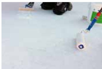
5. 2e laag KÖSTER 21