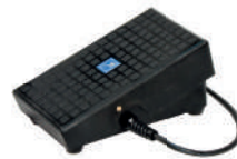
Optional FOOT REMOTE CONTROL