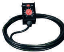
Optional REMOTE CONTROL