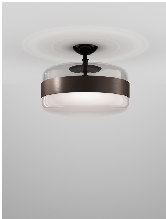
FUTUR PL G FUMA NE E27 CE