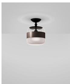
FUTUR PL P