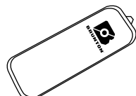
HeatSync Hot Zone