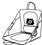
HeatSync Hot Seat