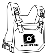
HeatSync Vital Heat