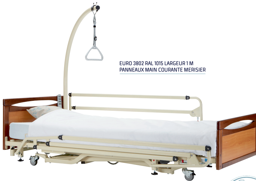
EURO 3802 RAL 1015 LARGEUR 1 M PANNEAUX MAIN COURANTE MERISIER

LIT ULTRA-BAS SPÉCIALEMENT CONÇU POUR LES PERSONNES DÉSORIENTÉES (HAUTEUR MINI. 21 CM). DESIGN ATTRACTIF AVEC CHÂSSIS CINTRÉ PERMETTANT LE PASSAGE D'UN SOULÈVE MALADE OU D'UNE TABLE DE LIT.