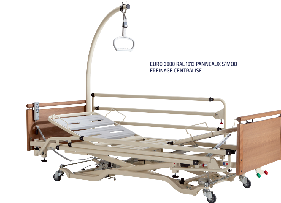
EURO 3800 RAL 1013 PANNEAUX S' MOD FREINAGE CENTRALISE