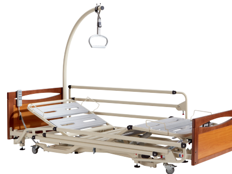
EURO 3802 RAL 1013 PANNEAUX MAIN COURANTE MERISIER