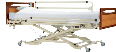
EURO 3802 RAL 1015 LARGEUR 1 M PANNEAUX MAIN COURANTE MERISIER, POSITION HAUTE