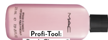
Profi-Tool: „Brush Cleanser“ von MAC, ca. 12 Euro.