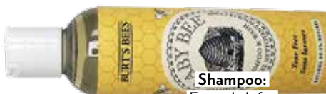
Shampoo: Eigentlich für Babys, von Burt's Bees, ca. 10 Euro.