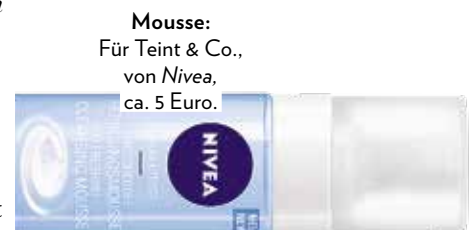
Mousse: Für Teint & Co., von Nivea, ca. 5 Euro.

Die handlichen Helfer können durch Hautkontakt, Cremereste und Make-up-Rückstände zu Bakterienschleudern werden. Dagegen hilft ein Waschgang mit milden Reinigern. Gründlich unter fließendem Wasser auswaschen und zum Trocknen mit dem Kopf nach unten hängen oder auf ein Handtuch legen, damit keine Feuchtigkeit in den Schaft gelangt, der das Material zum Quellen bringt und löst.