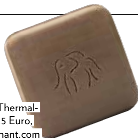
Seife: „JuJu Bar“ mit Thermalschlamm, ca. 25 Euro, über Drunkelephant.com