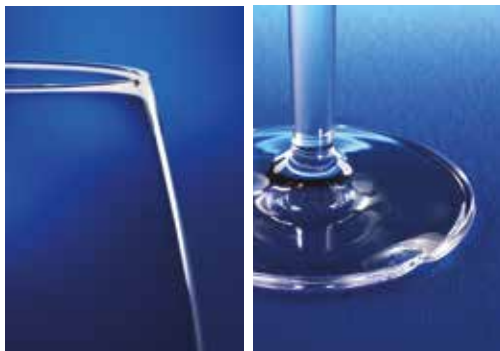
Example of chipping on the rim or foot, as a result of normal usage, which is covered under the details of the guarantee.