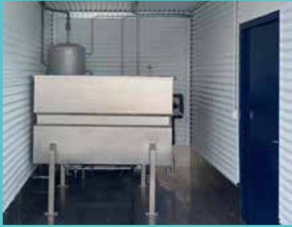
Pækilkerfi fyrir þá sem ekki hafa aðgang að sjó.