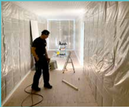
Gámarnir eru einangraðir.