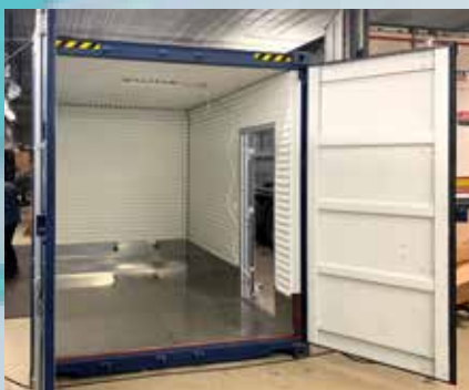
Góð opnun er á endanum og möguleiki á sér rými þar.