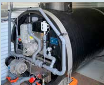
Forðatankur fyrir krapann til að stýra betur kælingu á vörunni.