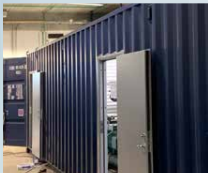
Klæðskerasniðinn kæligámur með hurðum á réttum stöðum.