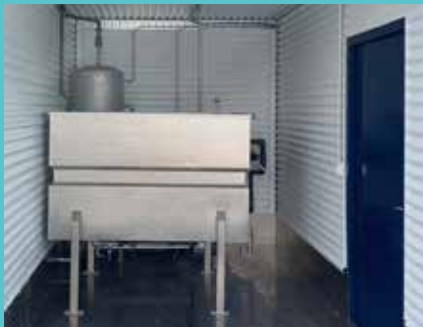
Pækilkerfi fyrir þá sem ekki hafa aðgang að sjó.