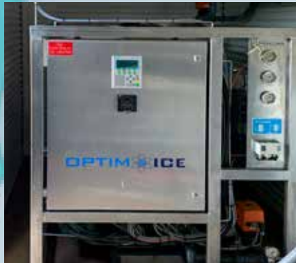
OptimICE® krapavél sem uppfyllir kælipörf sem hentar hverjum og einum.