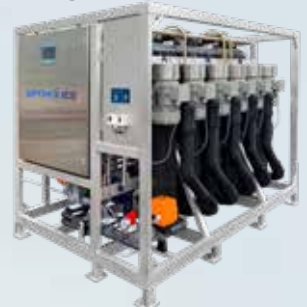
Krapavélin sér um að búa til fljótandi krapaís úr saltvatni.