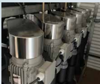
Með hágæða kælingu fæst betra hráefni og mun lengri hillutími.