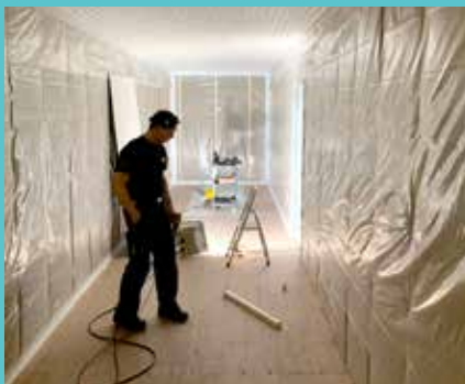
Gámarnir eru einangraðir.