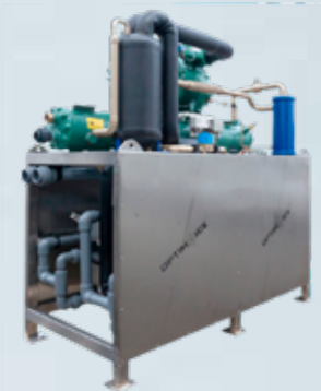
Forkælir sér um að halda jöfnu afköstum krapavélarinnar þegar hitastig er mismunandi.