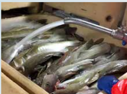
Hágæða kæling, þar sem kælikeðjan rofnar aldrei og hillitími lengist til muna.