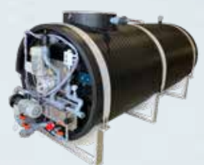
Forðatankurinn geymir krapaísinn og heldur honum í hámarksgæðum.