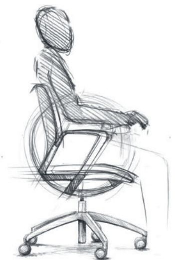
Drawings Schizzi: Paolo Fancelli