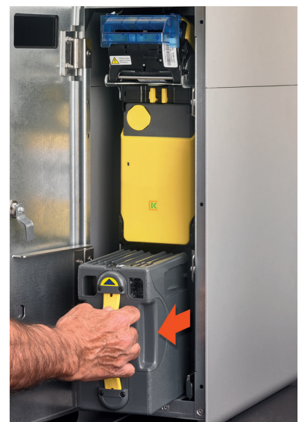
Recaudación de billetes en un módulo cerrado. Nadie ve ni toca el dinero