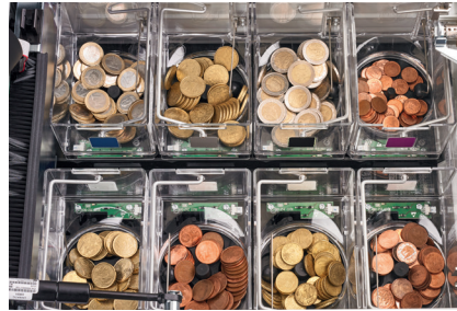
Cada moneda tiene su propio hopper. Máxima fiabilidad y rapidez