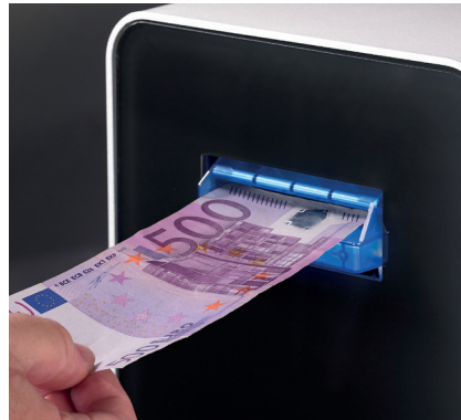
Acepta y verifica todos los billetes, incluyendo el de 500 €