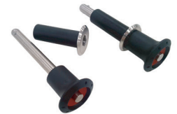
Sistema de anclaje desmontable (opcional)