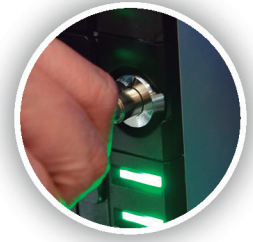
Bloqueos interiores de acceso al efectivo