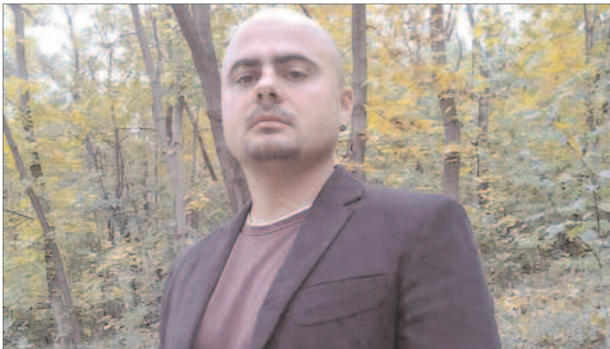
El escritor moldavo Vladimir Lórchénkov.