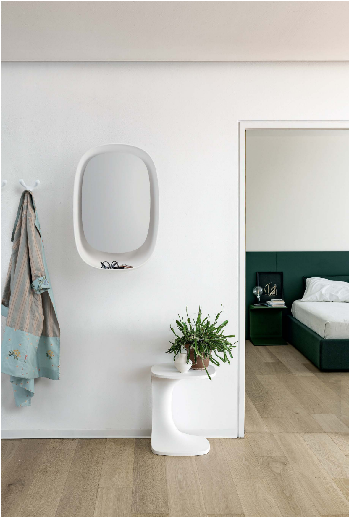
Takeoff mirror Cristalplant®