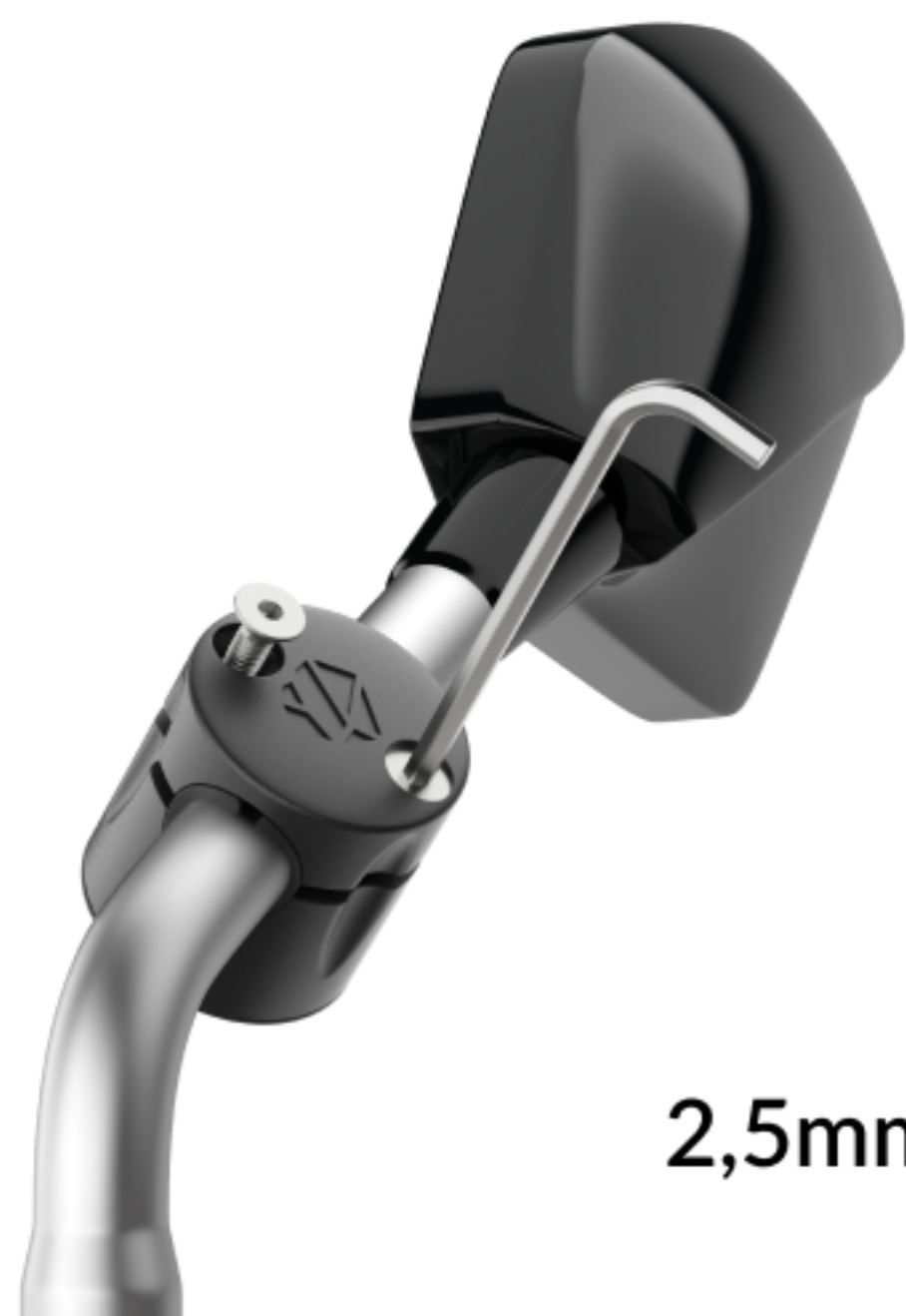
Ø 2,5mm HEX KEY