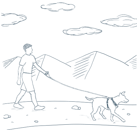
CORREA LARGA 2.1 mts

Cómo utilizar la correa Switchbak y adaptarse sobre la marcha mientras tu y tu perro exploran el mundo con correa.