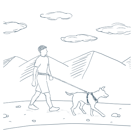
MANOS LIBRES A LA CINTURA