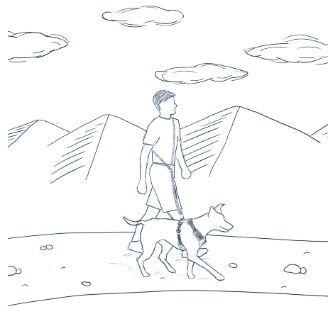
MANOS LIBRES AL HOMBRO