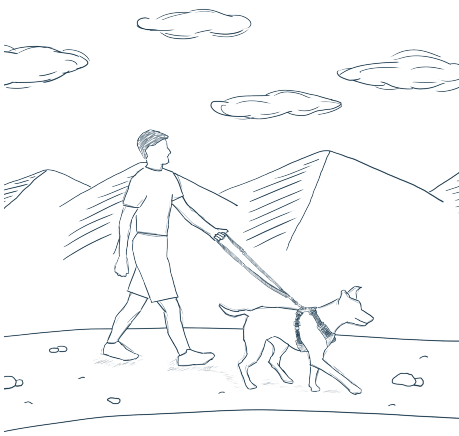
CORREA CORTA 70 cm