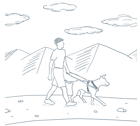
DOBLE ANCLAJE EN UN PERRO