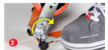
Pedal nach unten umlegen, um das Klebeband abzureißen