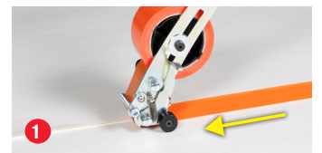
Das Klebeband in Vorwärtsbewegung abrollen