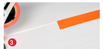
Fertig fixiertes Klebeband