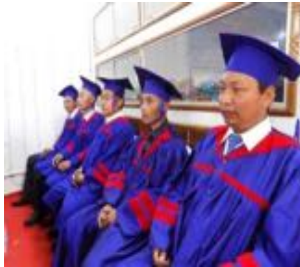
Arriba: Graduación y ordenación de ministros en el instituto en Manipur, India.