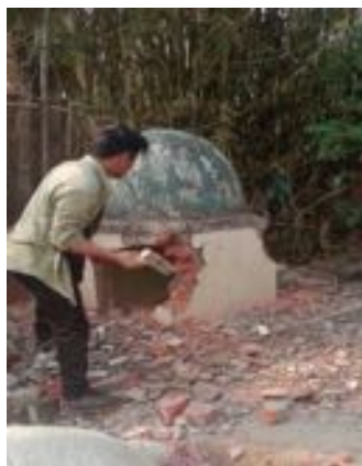
Arriba: En India, un nuevo convertido destruyendo su antiguo altar a otros dioses.