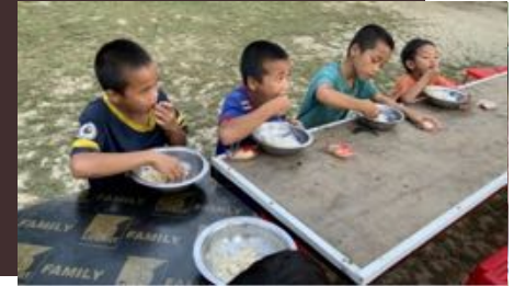
Los niños del orfelinato en Mayamar comiendo.