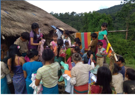
12 nuevos convertidos en la región de Maygone Division Mayamar recibiendo ropa.