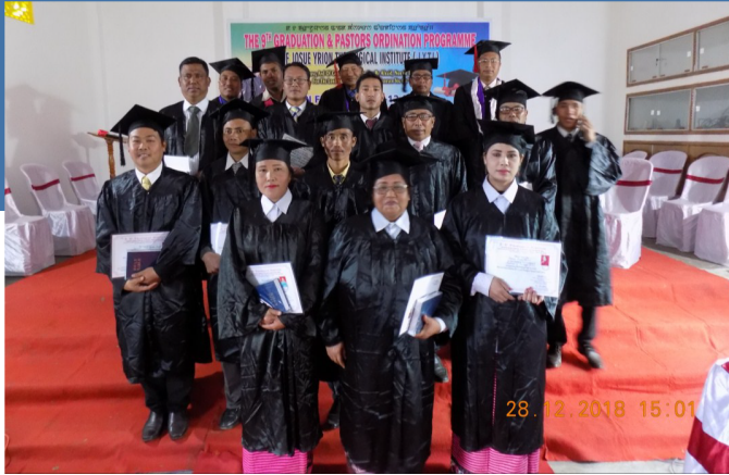
Graduación anual del instituto teológico Josue Yrion en la India.