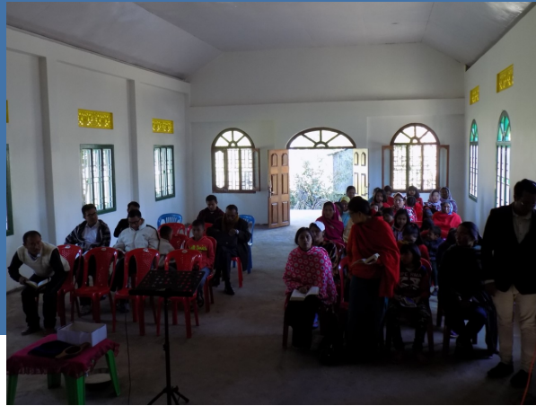
Cultos en la nueva iglesia que construimos en Nongpok, Manipur, India.

¡Gloria a Dios! El poder de Dios fue mayor que la resistencia satánica, y como resultado centenas de almas vinieron a los pies de Cristo. ¡Alabado sea Su Nombre! Muchísimas gracias hermanos por el apoyo que nos han dado con sus ofrendas y sus oraciones en todo el año 2018. Sé, cómo dijo el apóstol Pablo: "que todos estos frutos abundaran en vuestra cuenta... y mi Dios, pues, suplirá todo lo que os falta conforme a sus riquezas en gloria en Cristo Jesús." Filipenses 4:17b y 19