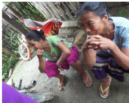
Reuniones de evangelismo para alcanzar a los budistas en Mayamar ex Birmania