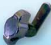
Knob for Pad Lock يد كروم لقفل كبس