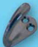
Coat Hanger علاقة