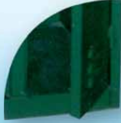
Short Panel Base قاعدة قصيرة