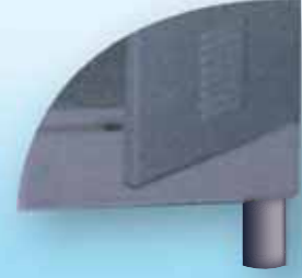
4 Legs 4 أرجل