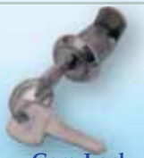
Cam Lock قفل سلندر مفتاح