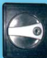
Flush Handle 3-Point Lock يد غير بارزة تغلق من 3 نقاط