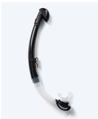
1005008 – Sort

Produkt navn: Ohio snorkel til unge Model Nr.: 1005008 Produkttype: Snorkel til voksne Identifikation: