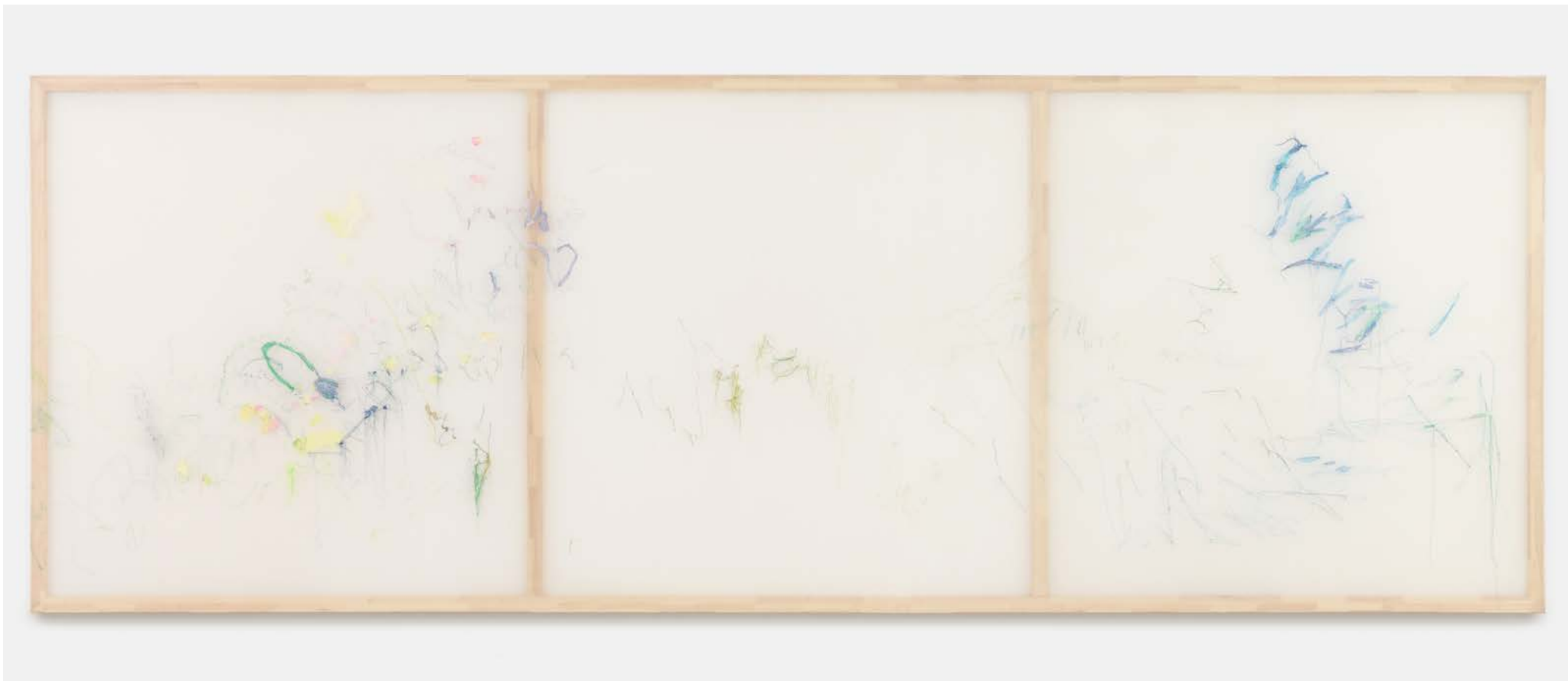
Jana Cordenier, Untitled, 2019, Embroidery on cotton, 180 x 500 cm