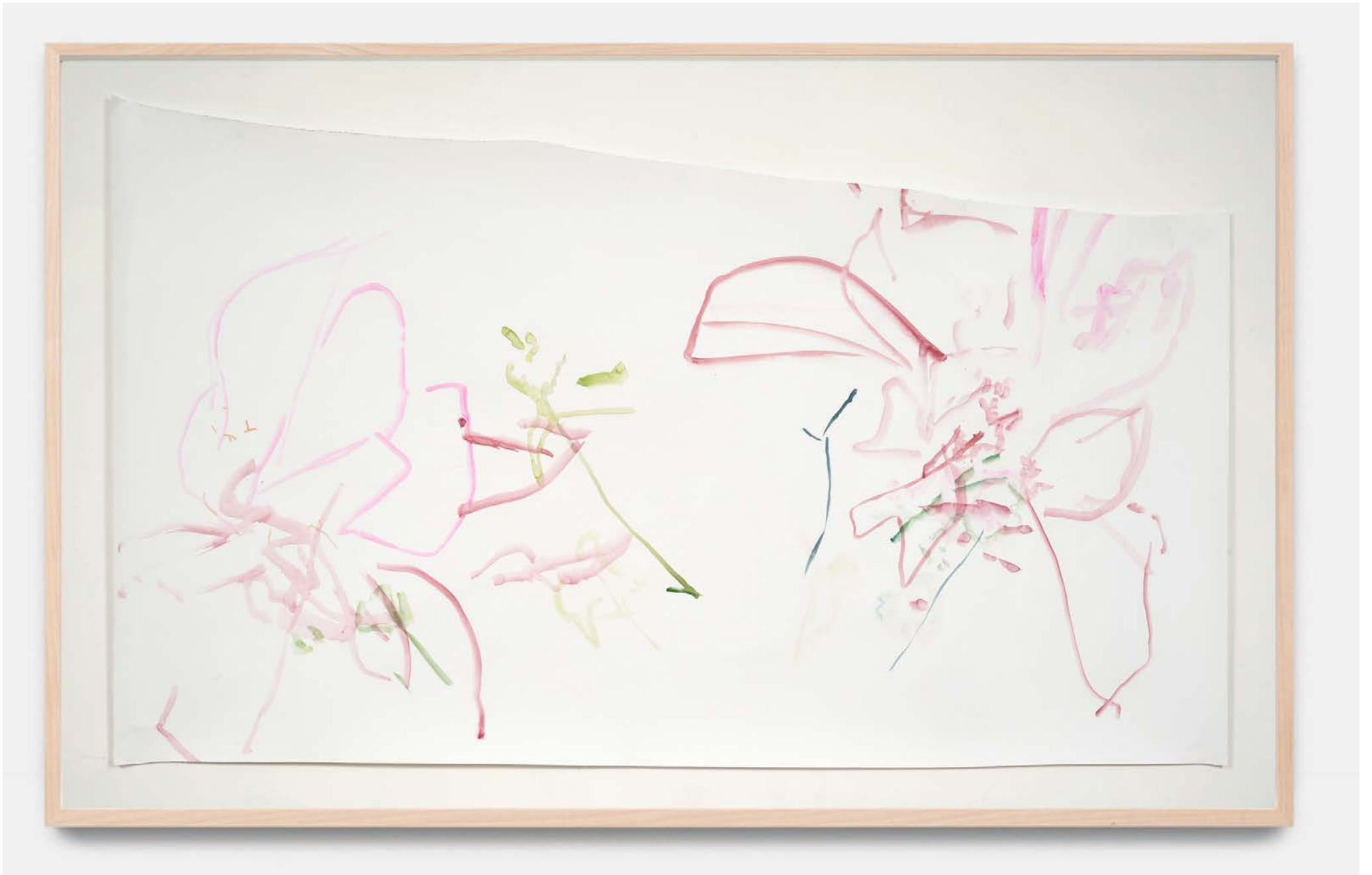
Jana Cordenier, Untitled, 2021, Watercolor on paper, 84 x 150 cm