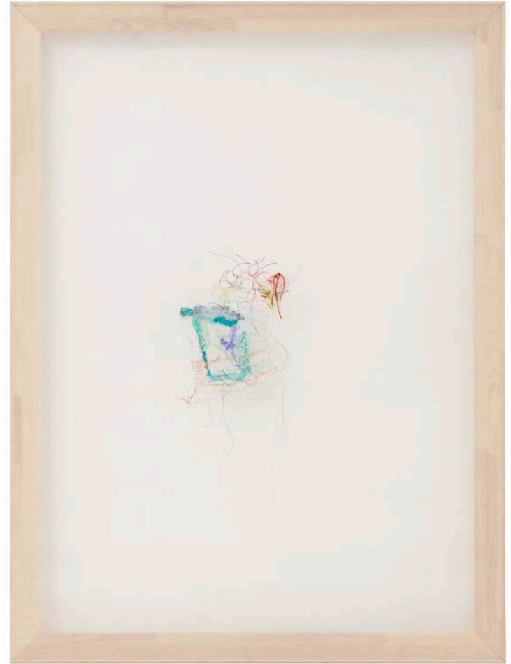
Jana Cordenier, Untitled (18.2023), 2023, Embroidery on cotton, 120 x 90 cm