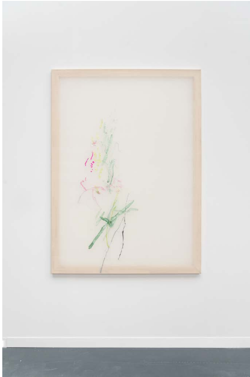
Jana Cordenier, Untitled (08.2021), 2021, Embroidery on cotton, 150 x 110 cm