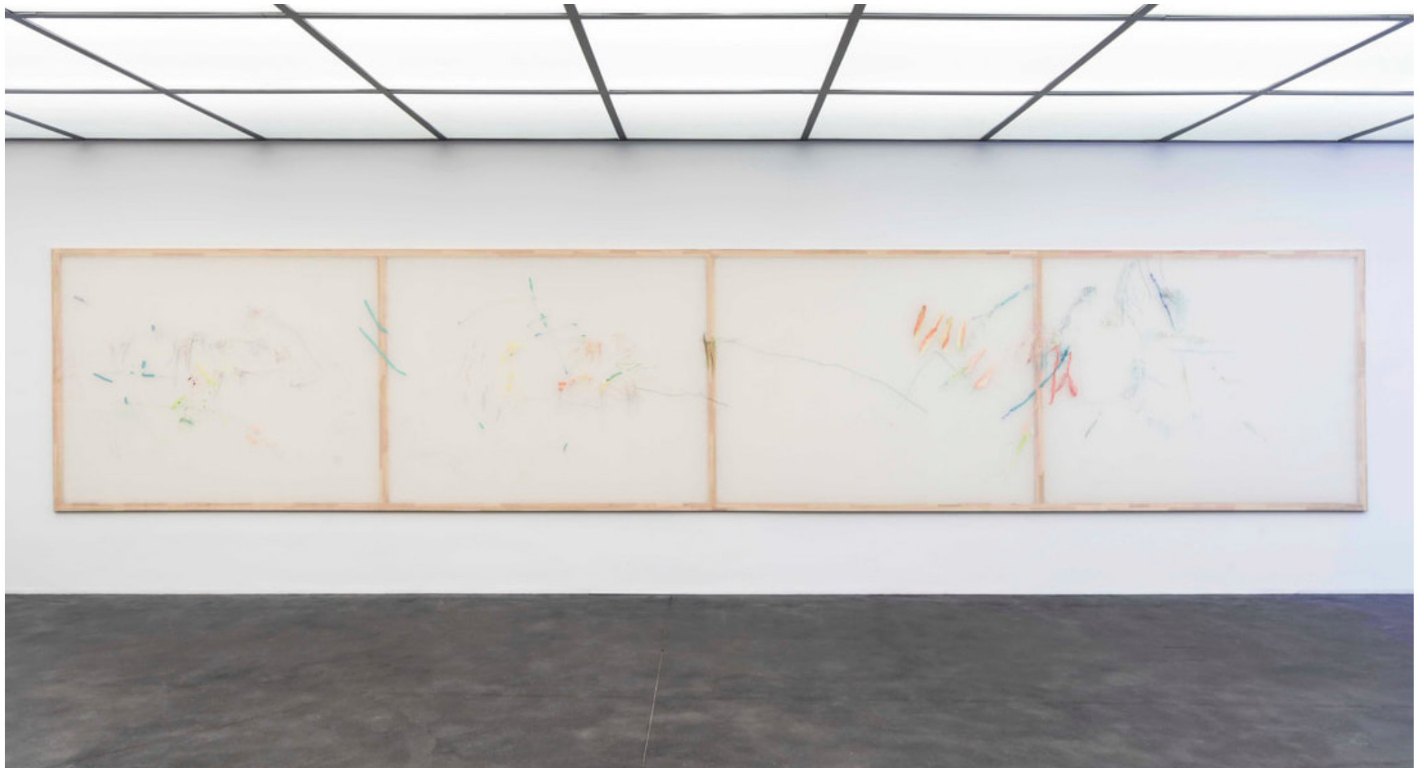
Jana Cordenier, Untitled, 2018, 180 x 900 cm, Installation view, Muurschilderingen, 2020, Raveelmuseum, Marthe Hoet