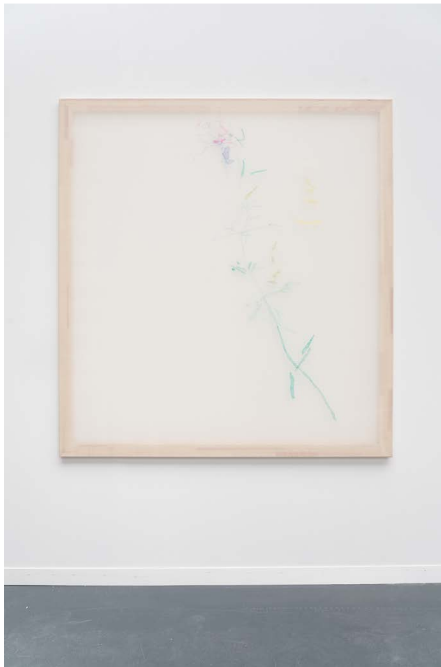
Jana Cordenier, Untitled (03.2022), 2022, Embroidery on cotton, 150 x 140 cm