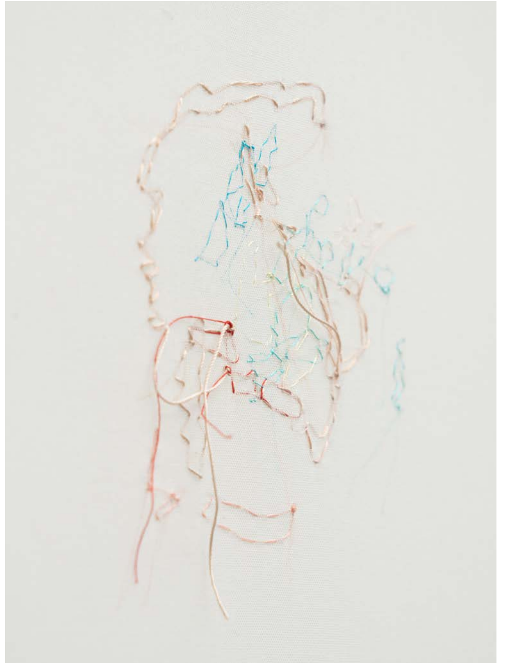
Jana Cordenier, Untitled (31.2020), 2020, Embroidery on cotton, 80 x 70 cm