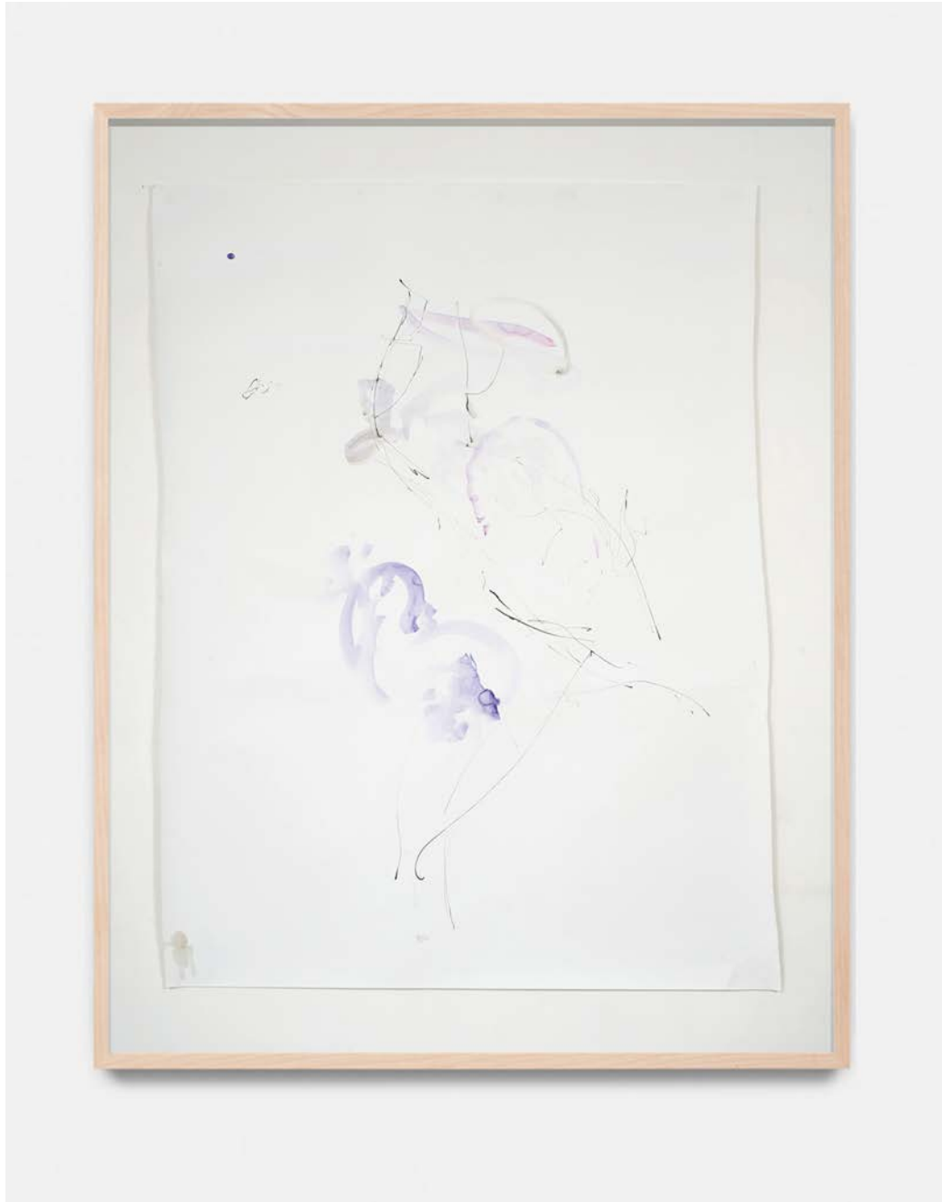
Jana Cordenier, Untitled, 2021, Watercolor on paper, 150 x 109 cm