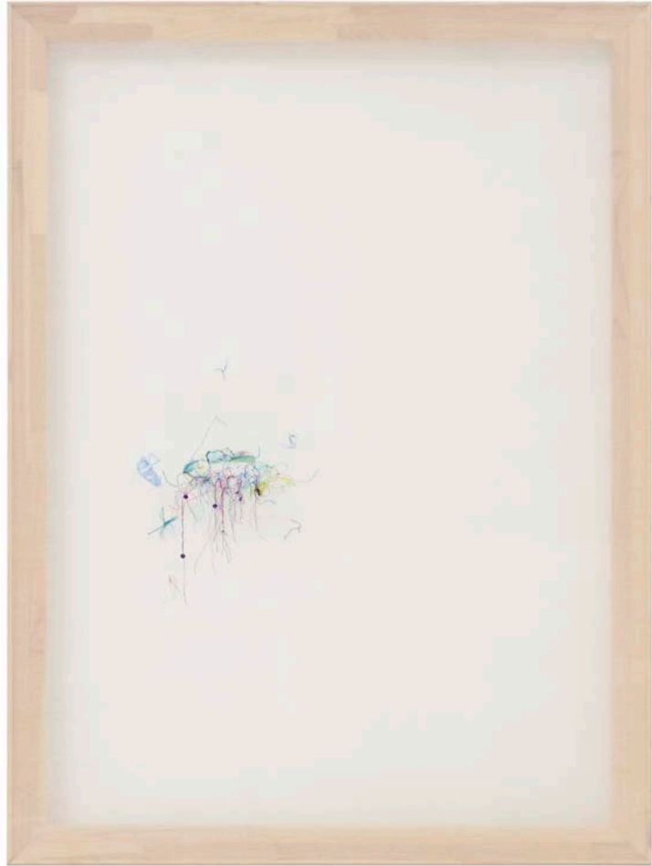
Jana Cordenier, Untitled (17.2023), 2023, Embroidery on cotton, 120 x 90 cm