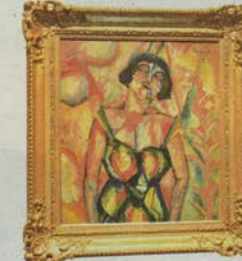
Georg Tappert „Sängerin“ soll 70 200 bis 93 600 Euro kosten