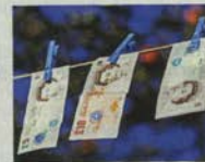
Ihren Ausweis, bitte! Ein neues Gesetz gegen Geldwäsche belastet den britischen Kunstmarkt

D er Handel mit Kunst ist ein Milliardengeschäft. London ist nach New York der zweitgrößte Umschlagplatz. Großbritannien der zweitgrößte Markt der Welt. Rund 12,7 Milliarden Euro Umsatz auf Auktionen und in Galerien machten die Briten allein im Jahr 2018. Die Zahlen basieren auf dem „Art Basel and UBS Global Art Market Report“. Doch nicht nur der Brexit könnte Käufer künftig verschrecken. Ein neues Gesetz zur Bekämpfung von Geldwäsche und Terrorismusfinanzierung versetzt dem Handel einen empfindlichen Dämpfer. Seit vergangener Woche ist es in Kraft. Nach den neuen Regeln müs-