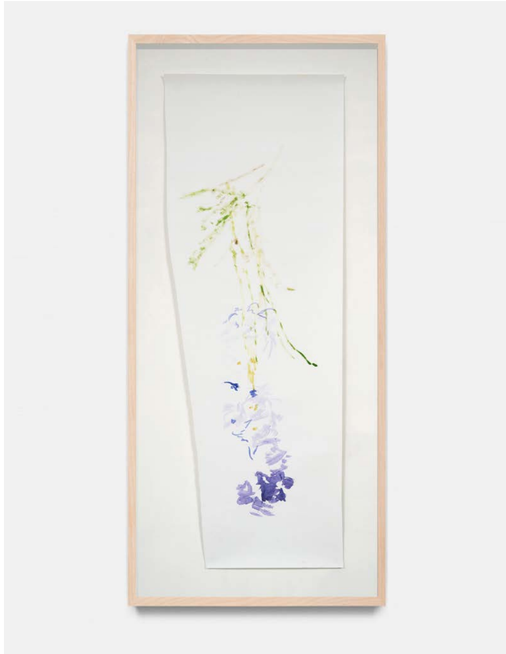
Jana Cordenier, Untitled, 2021, Watercolor on paper, 150 x 54 cm