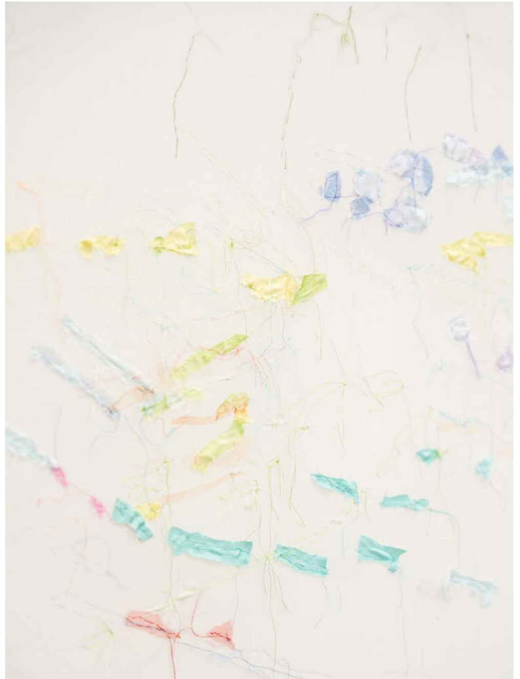
Jana Cordenier, Untitled (07.2022), 2022, Embroidery on cotton, 150 x 250 cm (detail)