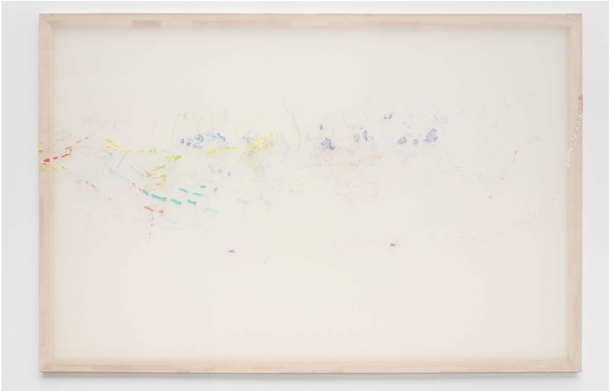
Jana Cordenier, Untitled (07.2022), 2022, Embroidery on cotton, 150 x 250 cm