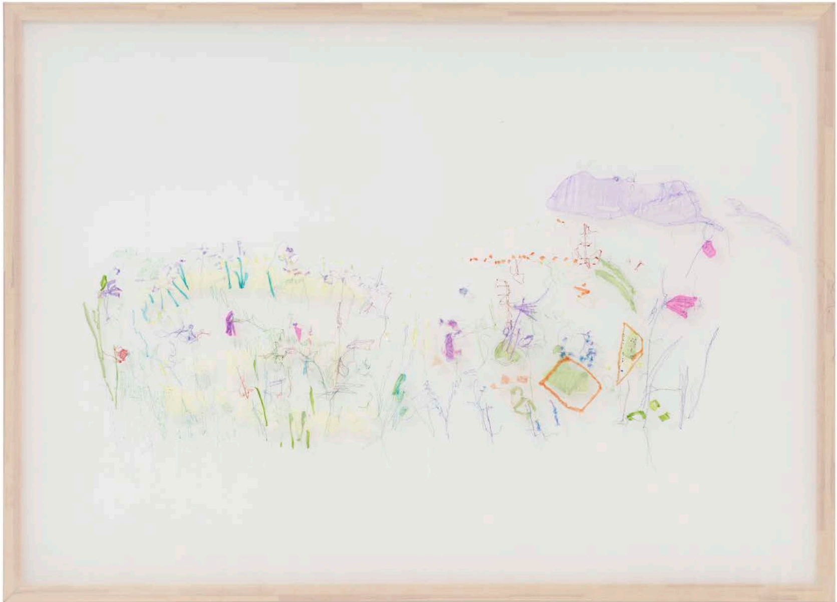
Jana Cordenier, Untitled (11.2023), 2023, Embroidery on cotton, 180 x 250 cm