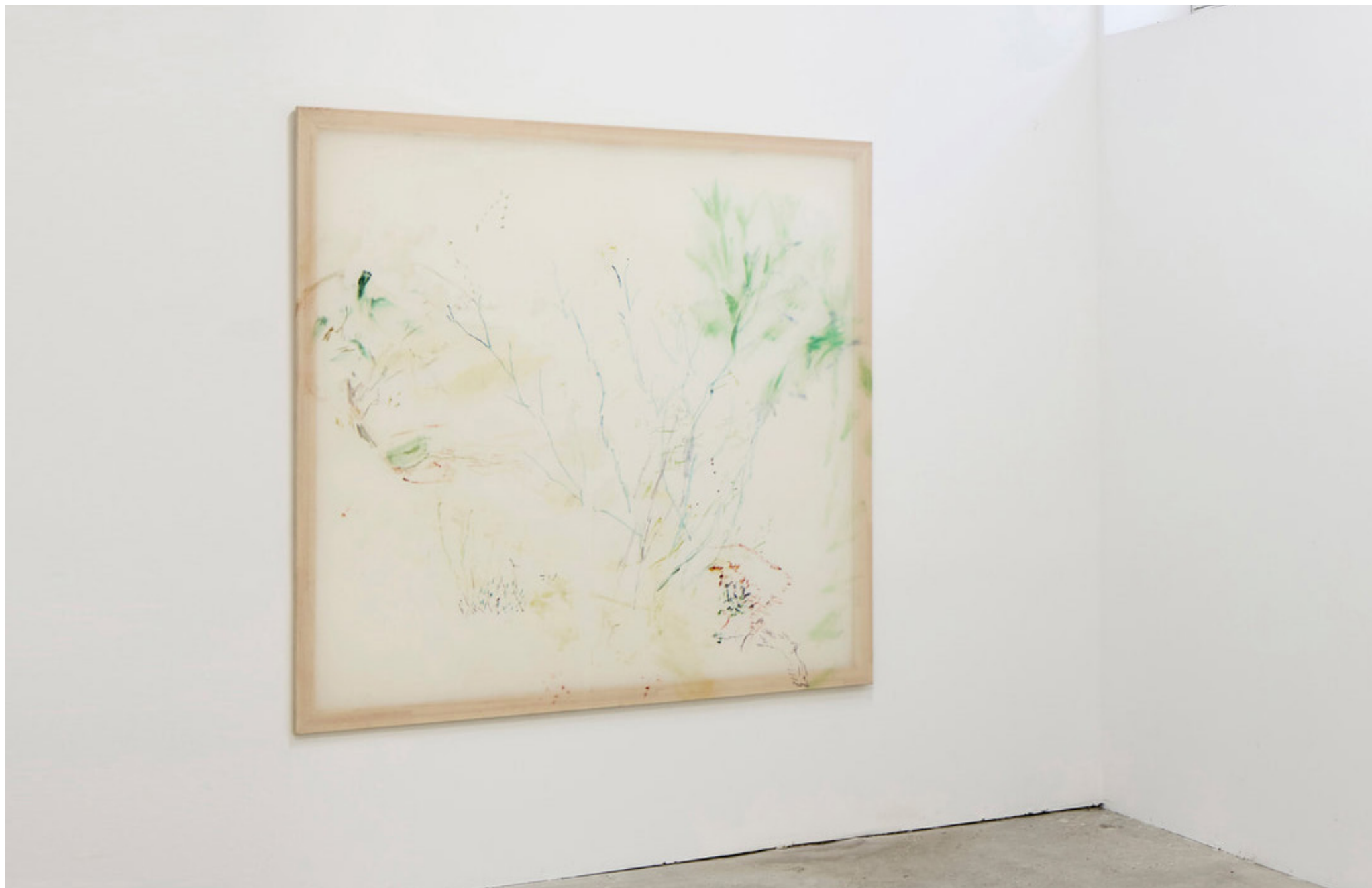
Jana Cordenier, Untitled, 2018, Oil on canvas, 170 x 175 cm