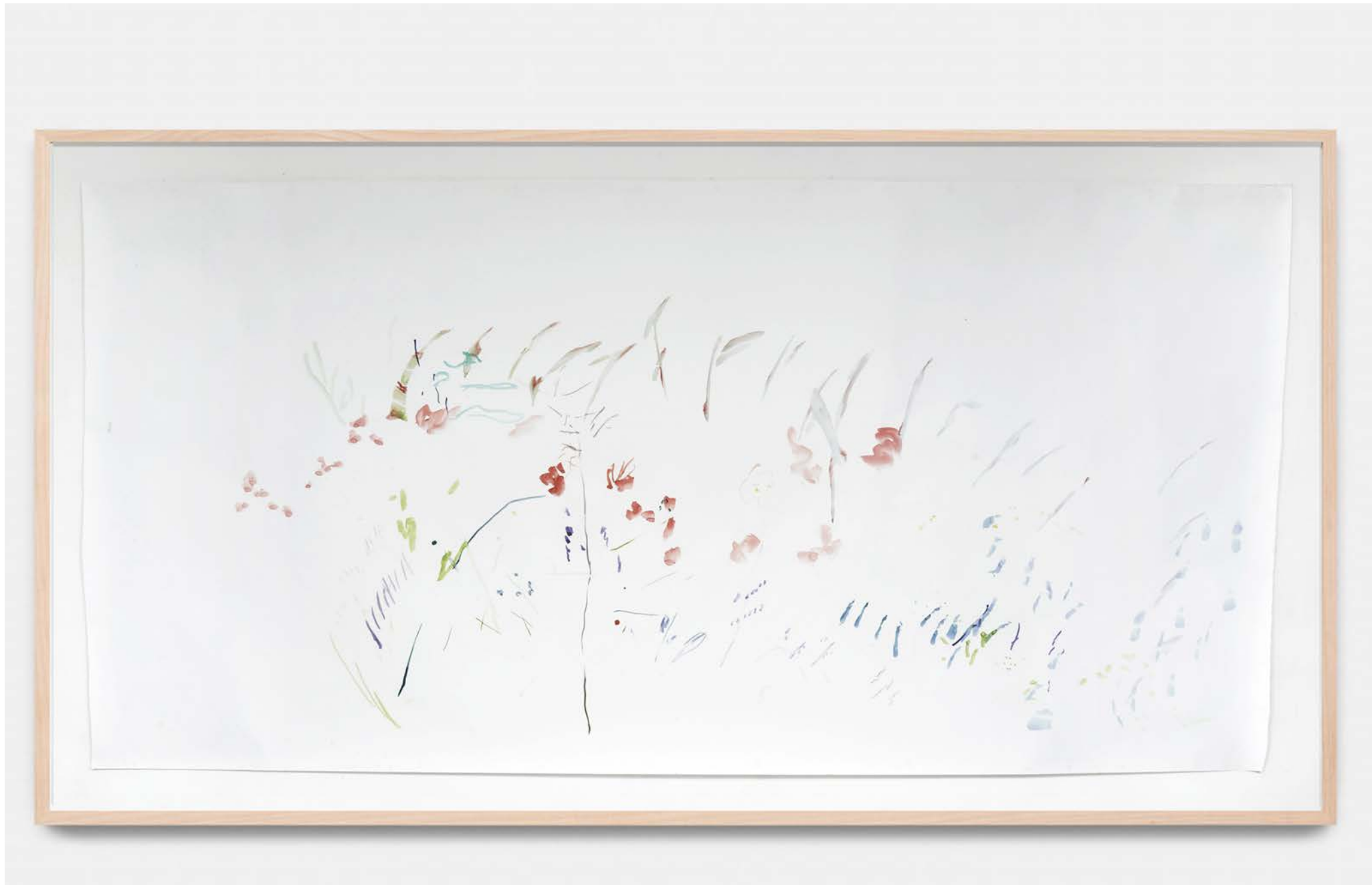
Jana Cordenier, Untitled, 2021, Watercolor on paper, 150 x 306 cm