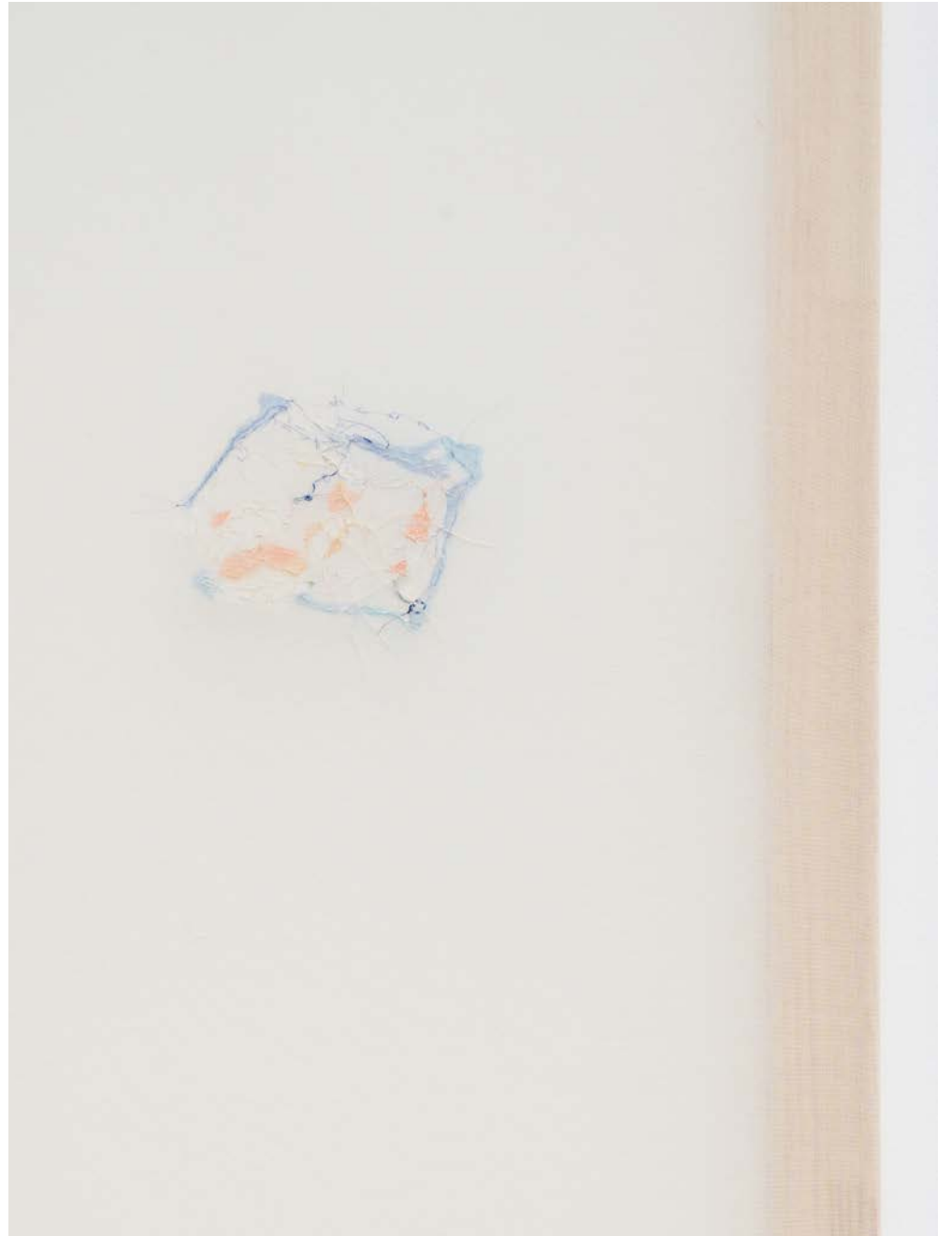
Jana Cordenier, Untitled (21.2020), 2020, Embroidery on cotton, 80 x 70 cm