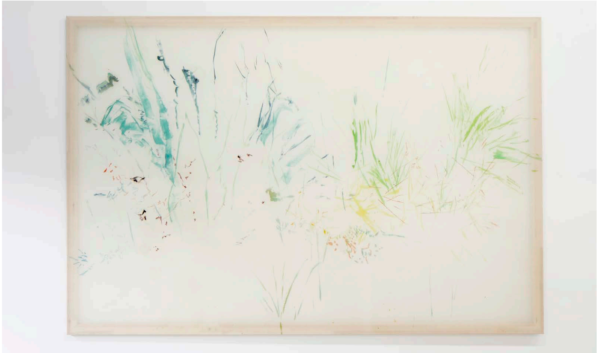
Jana Cordenier, Untitled, 2018, Oil on canvas, 170 x 250 cm