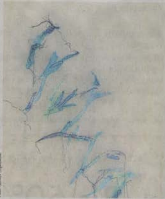
Stoff zum Träumen. Detail der Arbeit „Untitled“ von 2019 (180 x 500 cm).

druck der Lichtsituation und der sie umgebenden Farben – mit dem Pinsel das darunter Liegende: Zweige, Blumen, Blätter, Steine. Die so entstehenden Bilder sind nur ein Zwischenergebnis, sie dienen als Vorlage für die Übertragung auf den Baumwollstoff mit der halbtransparenten Anmutung von Pergamentpapier. „Jeder Stich der Nadel, der wie durch eine Haut die Schichten ihrer Leinwand durchdringt, beschreibt einen Gang durch die Zeit, eine Einladung des Betrachters zu einem Spaziergang, einem Erlebnis“.