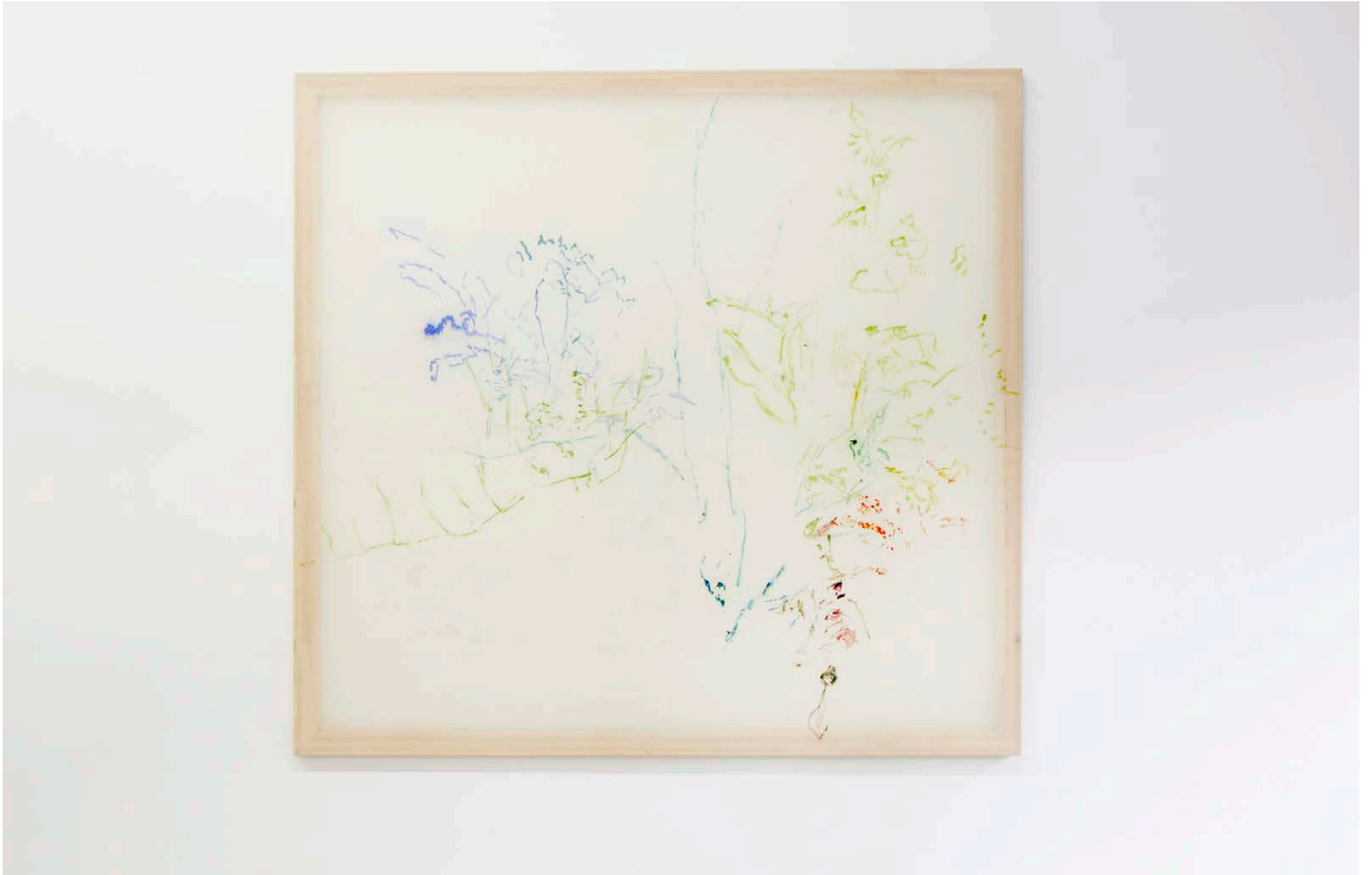
Jana Cordenier, Untitled, 2018, Oil on canvas, 160 x 170 cm