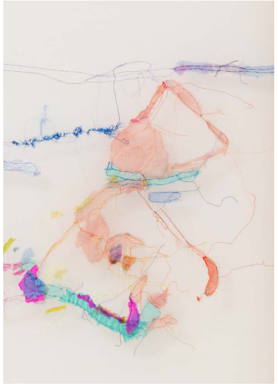
Jana Cordenier, Untitled (08.2023), 2023, Embroidery on cotton, 180 x 170 cm (details)