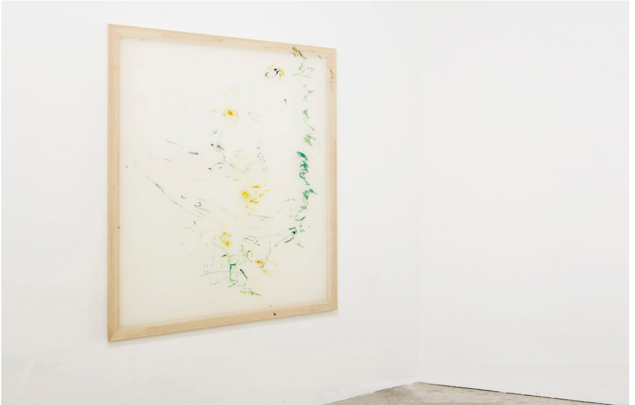
Jana Cordenier, Untitled, 2018, Oil on canvas, 150 x 130 cm