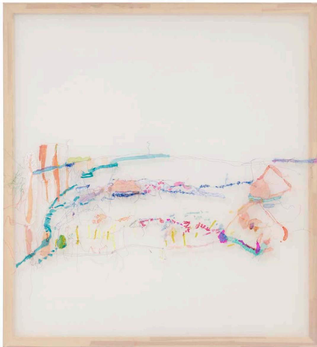
Jana Cordenier, Untitled (08.2023), 2023, Embroidery on cotton, 180 x 170 cm