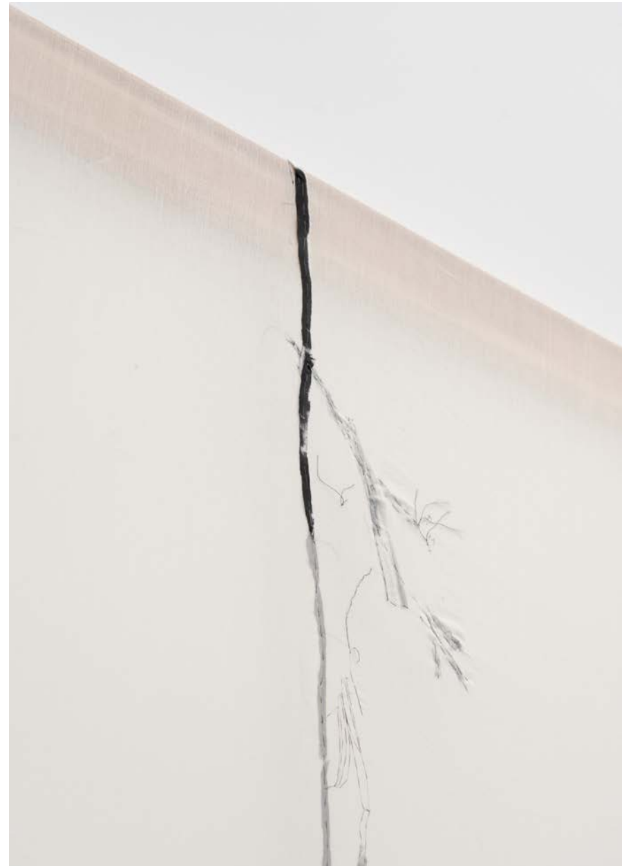
Jana Cordenier, Untitled (05.2021), 2021, Embroidery on cotton, 150 x 110 cm