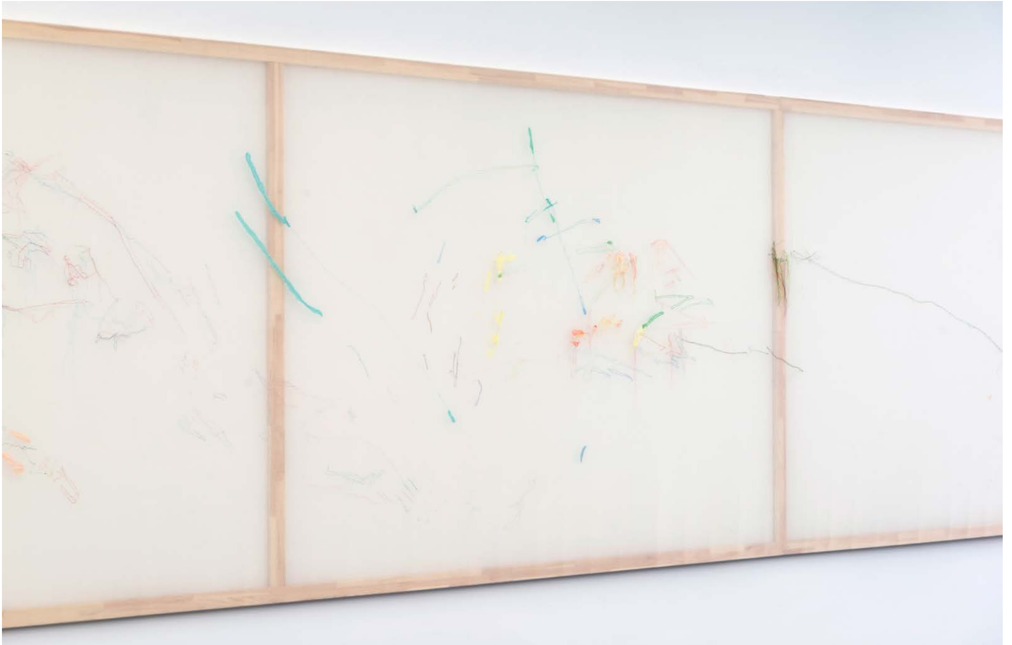
Jana Cordenier, Untitled, 2018, Embroidery on cotton, 180 x 900 cm