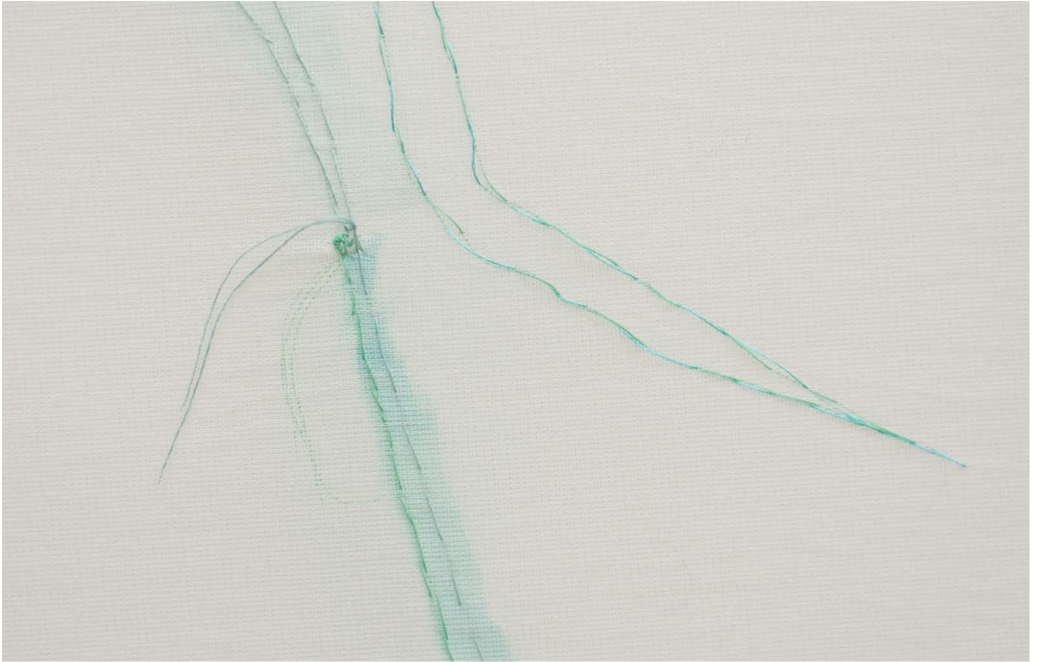
Jana Cordenier, Untitled (03.2022), 2022, Embroidery on cotton, 150 x 140 cm (detail)