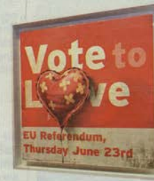
Banksy „Vote to Love“, Schätzpreis: 468 000 bis 702 000 Euro

sen sich bei einem Deal ab 10 000 Euro sowohl Käufer als auch Verkäufer bei der Steuerbehörde registrieren lassen. Die „Endbegünstigten“, also im Prinzip beide, müssen einen Lichtbildausweis vorlegen und ihre aktuelle Wohnadresse angeben. Bisher galten solche Auflagen in Großbritannien nur in bestimmten Fällen von Kunstverkäufen, etwa bei hohen Bargeldbeträgen. Jetzt sind nicht nur Auktionshäuser und Kunsthändler, sondern auch Privatpersonen betroffen.