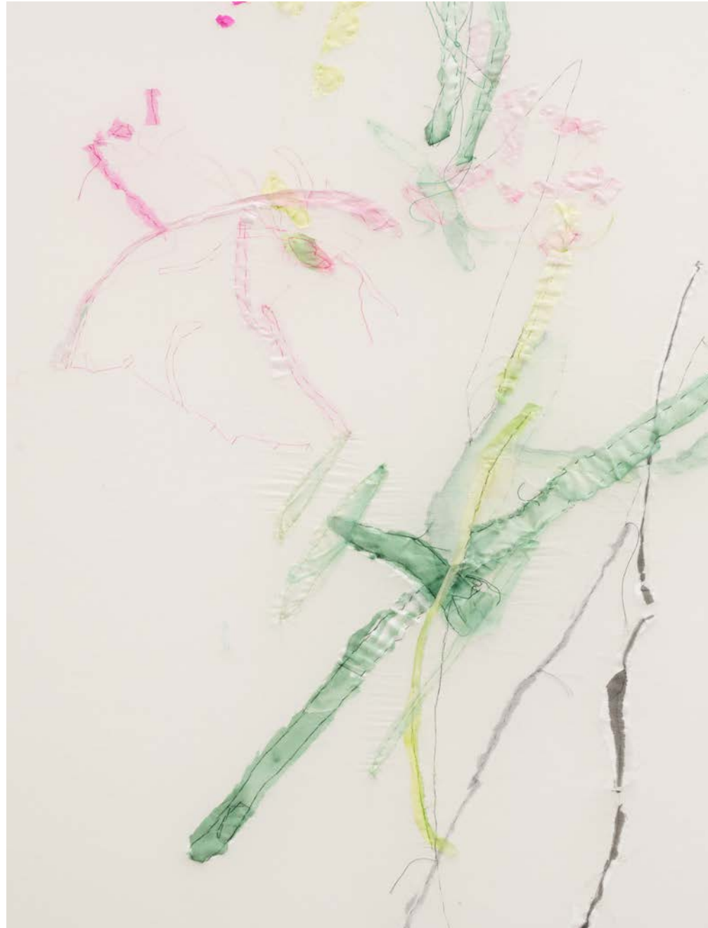
Jana Cordenier, Untitled (08.2021), 2021, Embroidery on cotton, 150 x 110 cm (detail)