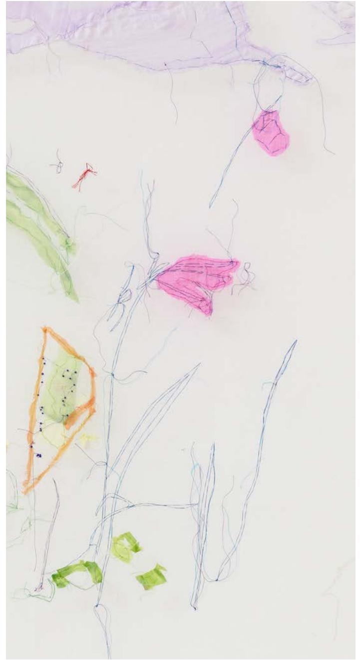
Jana Cordenier, Untitled (11.2023), 2023, Embroidery on cotton, 180 x 250 cm (details)