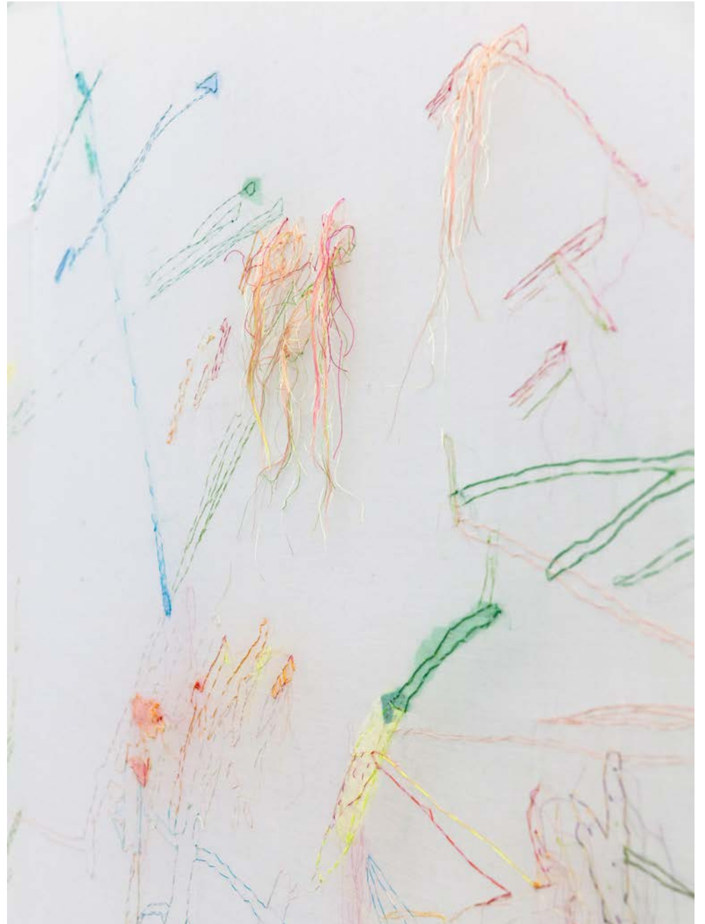
Jana Cordenier, Untitled, 2018, Embroidery on cotton, 180 x 900 cm (detail)