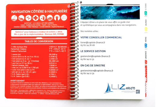
Exemple de page recto-verso personnalisée pour les Yachts Clubs, Associations et Entreprises nautiques

Avec 25 000 exemplaires diffusés en 5 ans, Safetics® a développé une communauté d'utilisateurs fidèles et un réseau de plus de 400 accastilleurs et librairies en France, Suisse, Belgique, Espagne, Italie, et Caraïbes , dont 25% distribuent l' édition anglaise sortie en 2018. Au Royaume-Uni et en Irlande , l'équipe Safetics® vient de signer un accord avec les leaders de l'édition nautique Chartco et Imray ainsi que 30 accastilleurs locaux.