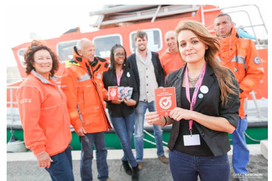
L'équipe Safetics® avec les sauveteurs en mer de la station SNSM de la Ciotat.