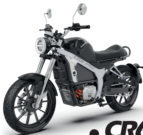
● CR6 Pro

Attraktives Design, neueste E-Technologie