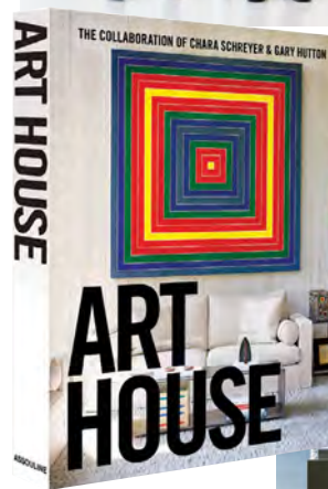
ARRIBA: PORTADA DEL LIBRO; ARRIBA, DCHA.: KEITH TYSON, STUDIO WALL DRAWING; DOMESTIC PAIRS-LAMPS, 2000; DCHA.: MAN RAY, CADEAU, 1962.