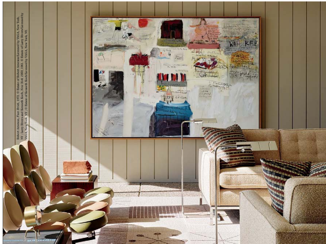
Robert Rauschenberg, Four Black , 1972. © Estate of Robert Rauschenberg/Licensed by VAGA, New York, NY; Larry Rivers and Kenneth Koch, New York 1959, 1961 . © Estate of Larry Rivers/Licensed by VAGA, New York, NY; © Estate of Kenneth Koch/Licensed by VAGA, New York, NY.