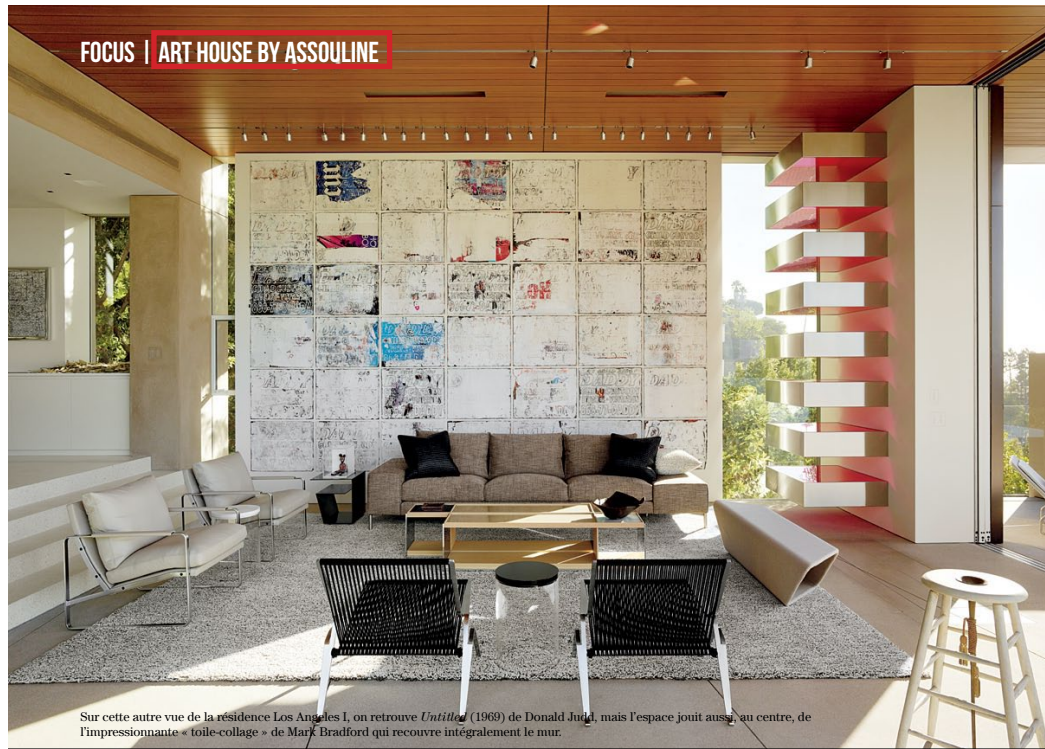
Sur cette autre vue de la résidence Los Angeles I, on retrouve Untitled (1969) de Donald Judd, mais l'espace joint aussi, au centre, de l'impressionnante « toile-collage » de Mark Bradford qui recouvre intégralement le mur.

Richard Artschwager, Days II , 1973. © 2015 Richard Artschwager/Chelsea Rights Society (ARS), New York. The White, November Gutter Leaves, Pasadena , 2000. Kristina Morfitt, House 1804, Grant , 2011. Mark Bradford, A Thousand Details , 2008. © Mark Bradford, courtesy of the artist and Hauser & Wirth; Donald Judd, Untitled , 1969. © Judd Foundation/Licensed by VAGA, New York, NY; Christian Marclay, Stool , 1992. © Christian Marclay, courtesy Paula Cooper Gallery, New York.