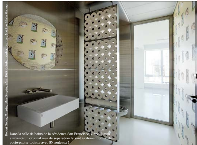
Robert Gober, Hamming Man/Stripping Man , 1989. © Robert Gober, courtesy Matthew Marks Gallery.

Art House est disponible dans les boutiques Assouline à travers le monde, et sur www.assouline.com