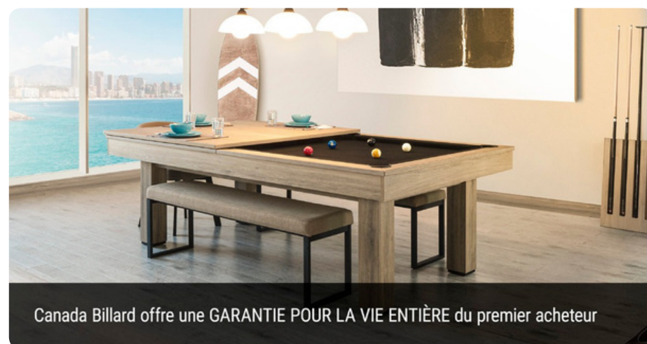
Canada Billard offre une GARANTIE POUR LA VIE ENTIÈRE du premier acheteur

L'obligation de CANADA BILLARD en regard de cette garantie se limite au remplacement ou la réparation des pièces jugées défectueuses. En aucune circonstance CANADA BILLARD n'acceptera de responsabilité pour tout dommage découlant de la défectuosité de la table, incluant, mais sans se limiter à, tout dommage découlant de l'usage ou de la perte d'usage du produit.