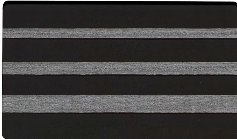
Sewing sample 縫製見本