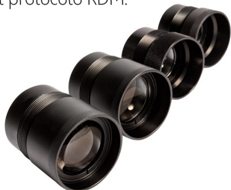
Cuatro opciones de lentes disponibles