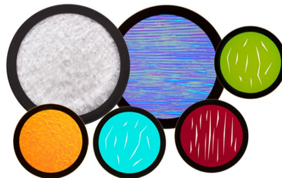
Motores de efectos personalizados