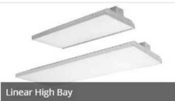
Linear High Bay