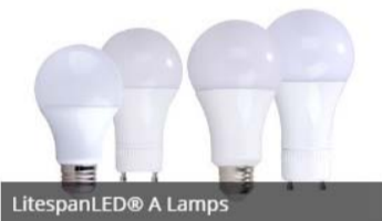
LitespanLED® A Lamps