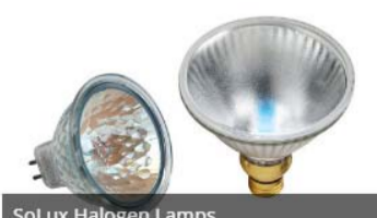
SoLux Halogen Lamps