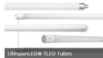
LitespanLED® TLED Tubes