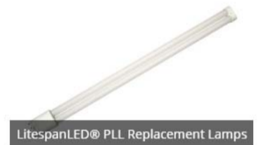
LitespanLED® PLL Replacement Lamps