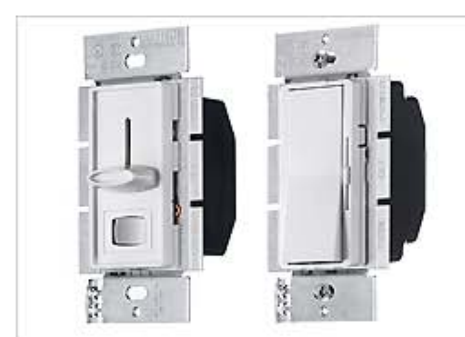
DIMMERS / FAN SPEED CONTROLS