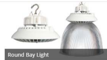
Round Bay Light