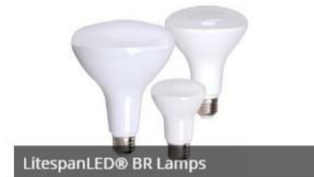
LitespanLED® BR Lamps