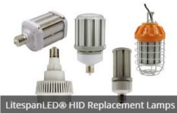
LitespanLED® HID Replacement Lamps