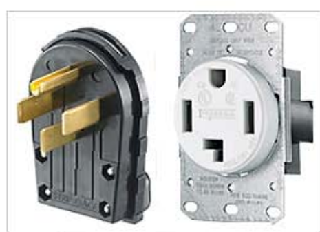
RANGE & DRYER