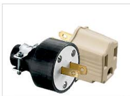
PLUGS & CONNECTORS