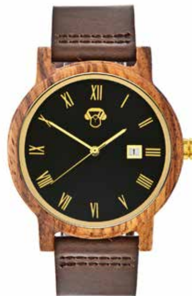
KACHU ZEBRANO CUERO