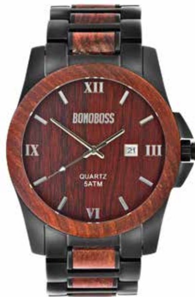
LICKAN ANTAI NEGRO SÁNDALO ROJO