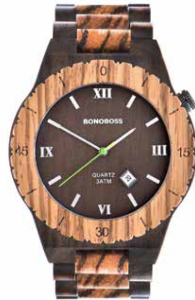
SEQUITOR ZEBRANO / SÁNDALO