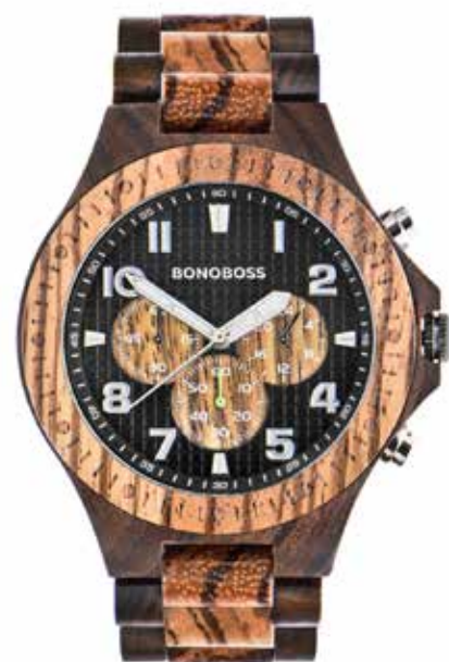
PETROHUÉ ZEBRANO / SÁNDALO