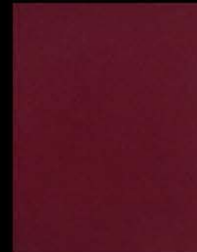
marsala sablé sandblasted marsala