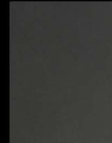
grigio ardesia sablé sandblasted ardesia grey