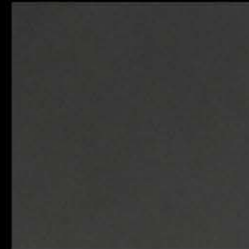
grigio ardesia opaco mat ardesia grey