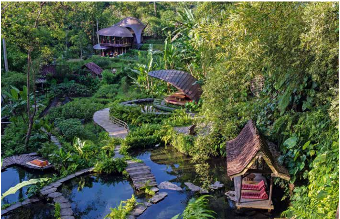
Wunderland inmitten smaragdgrüner Natur: natürliche Schwimmteiche und Pavillons des Boutiquehotels Bambu Indah am Ayung River.

A wonderland surrounded by the emerald embrace of nature: natural pools and gazebos of the villas of the boutique hotel Bambu Indah, which is located by the Ayung River.