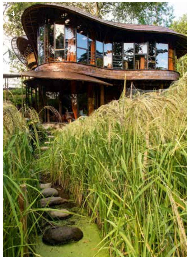
1. Elora Hardy (links) in balinesischer Tracht mit Angestellten des Bambu Indah. / 2. Bad mit Blick ins Schlafzimmer des Bridal House «Jawa Lama». / 3. Wanne in der Natur: Bad des Riverbend House am Ayung River. / 4. Eloras jüngstes Projekt: das Riverbend House.