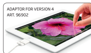
ADAPTOR FOR VERSION 4 ART. 96902