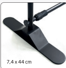
7,4 x 44 cm

We recommend 210 g Frame Tex 100 % knitted polyester