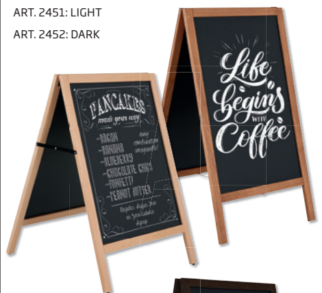
ART. 2451: LIGHT ART. 2452: DARK