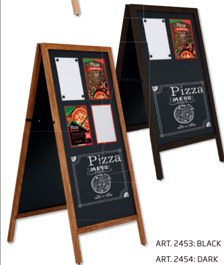
ART. 2453: BLACK ART. 2454: DARK