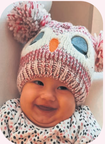
Euné Dekker van Verwoerdpark in Alberton is op 12 November 2020 gebore.