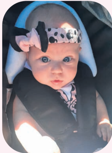
Leah de Bie van Langenhovenpark in Bloemfontein is op 25 Januarie 2021 gebore.