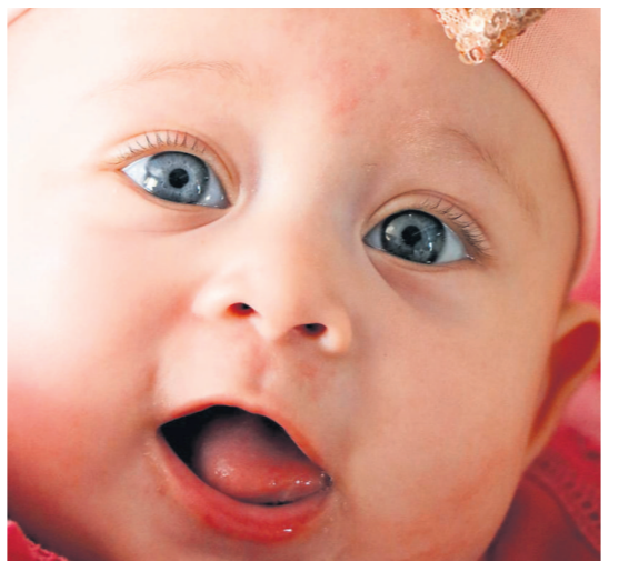
Elri Nryman van Viljoenskroon in die Vrystaat is op 22 Februarie 2021 gebore.