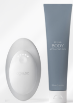
ageLOC WELLSPA iO - ROUTINE RESTORE (APPAREIL + ageLOC BODY ACTIVATING GEL)