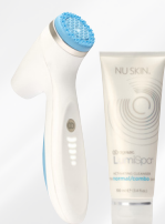
SYSTÈME ageLOC WELLSPA iO (appareil avec les ageLOC LumiSpa Activating Cleansers)