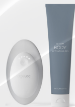
ageLOC WELLSPA iO - ROUTINE RELAX (APPAREIL + ageLOC BODY ACTIVATING GEL)