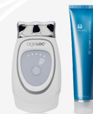
ageLOC GALVANIC FACIAL SPA AVEC ageLOC BODY SHAPING GEL