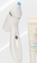
ageLOC LUMISPA iO ACCENT (appareil avec l'ageLOC LumiSpa IdealEyes)