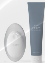
ageLOC WELLSPA iO - ROUTINE RELAX (APPAREIL + ageLOC BODY ACTIVATING GEL)