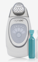
SYSTÈME ageLOC GALVANIC FACIAL SPA (appareil avec ageLOC Facial Gels)