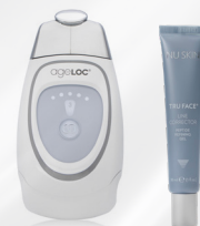
ageLOC GALVANIC FACIAL SPA AVEC TRU FACE LINE CORRECTOR