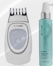
ageLOC GALVANIC FACIAL SPA AVEC ageLOC NUTRIOL INTENSIVE SCALP & HAIR SERUM