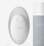
ageLOC WELLSPA iO - ROUTINE REVITALISE (APPAREIL + ageLOC BODY SERUM)