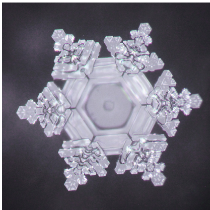
„La plaque mom“

Enfin, les séries de tests ont été examinées à l'aide d'un microscope à fond clair à -5 °C et photographiées.