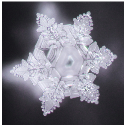
„Pendentif énergétique mom“