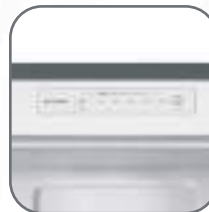
Control digital interior