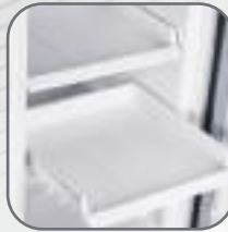
Bandejas de plástico